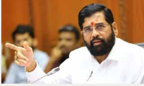
करण्यात यावी, असे निर्देशही मुख्यमंत्री श्री. शिंदे यांनी दिले आहेत.

चंद्रपूर : 'मुख्यमंत्री - माझी लाडकी बहीण' योजनेसाठी आवश्यक प्रमाणपत्रे देणे, अर्ज भरून घेणे यासह या संपूर्ण प्रक्रियेत महिलांची अडवणूक केल्यास, प्रक्रियेत दिरंगाई केल्यास किंवा योजनेच्या लाभासाठी महिलांकडून पैशांची मागणी करीत असल्याचे निदर्शनास आल्यास अशा अधिकारी, कर्मचाऱ्यांवर कठोर कारवाई करण्यात यावी, अशा सक्त सूचना मुख्यमंत्री एकनाथ शिंदे यांनी दिल्या आहेत. त्याचबरोबर ही संपूर्ण प्रक्रिया पारदर्शकपणे आणि जलदगतीने होईल, यासाठी जिल्हाधिकाऱ्यांनी लक्ष ठेवावे. या योजनेचे संनियंत्रण करण्यासाठी प्रत्येक जिल्ह्यात नोडल अधिकाऱ्यांची नियुक्ती