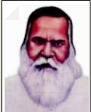
स्वर्वेद रचनाकार अनन्त श्री सद्गुरू सदाफल देवजी महाराज

संदर्भ : हा ग्रंथ तुम्हाला हवा असल्यास वॉट्सअप करा ८५५४८८३१६६.