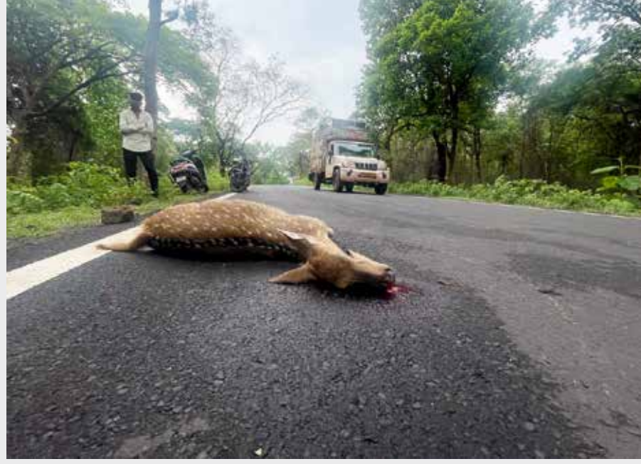
क्षेत्रात पदमापूर ते मोहली गतिरोधक चा रस्ता सार्वजनिक बांधकाम विभागाने बांधला आहे मग

सोसायटी ने विरोध केला होता पण तात्पुरता वेळेवर स्थगिती देऊन कालांतराने रुंदीकरण करण्यात आले, हा रस्ता बाबुपेट-जुनोना-बल्लारशाह, जुनोना-चिचपल्ली व पौर्णमा हा संपूर्ण ४२ किलोमीटर व बाबुपेट-चिचपल्ली २६ किलोमीटर चा रस्ता संपूर्ण जंगलातून जातो व नेहमी वन्यप्राण्याचा वावर असल्याने गती रोधकांची मागणी संस्थेतर्फे करण्यात आली होती. ह्या एका महिन्यात दोन चितळ व एका सांबरचा मृत्यू बाबुपेट-जुनोना रस्त्यावरती झाला आहे, काही वर्षांपूर्वी जुनोना पासून काही अंतरावर एका वाघाचा सुद्धा अपघाती मृत्यूची नोंद आहे, आणि एका अस्वलाची सुद्धा, इतके अपघात होत असतांना सार्वजनिक बांधकाम विभाग, रस्ता सुरक्षा समिती गती-रोधक देण्यास का धजावत आहे माहिती नाही, पण ह्या रस्त्यावर रेंती चे ट्रक रात्री खूप वेगाने धावतात, ह्यात रेंती वाहतूक करणाऱ्या ट्रक ने अस्वलाचा जीव घेतला होता, पण हि वाहतूक रात्रीची का होते हे मात्र कळायला मार्ग नाही. आणखी किती वन्यजीवांचा बळी गेल्यावर सार्वजनिक बांधकाम विभाग, रस्ता सुरक्षा समिती जागी होणार आहे कुणास टाऊक,ताडोबाच्या बफर