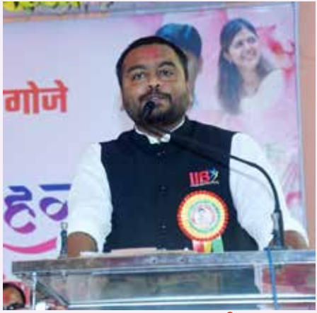
आधुनिक केसरी न्यूज