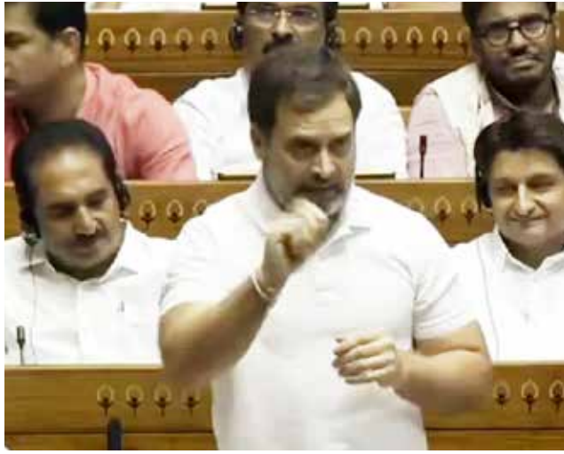
आधुनिक केसरी न्यूज

नवी दिल्ली : नरेंद्र मोदी संपूर्ण हिंदू समाज नाहीत. भाजप हा संपूर्ण हिंदू समाज नाही. आरएसएस हा संपूर्ण हिंदू समाज नाही. हा भाजपचा ठेका नाही. स्वतःला हिंदू म्हणवून घेणारे २४ तास हिंसा करतात, असे म्हणत पहिल्याच भाषणात संसदेतील विरोधी पक्षनेते राहुल गांधी यांनी पंतप्रधान नरेंद्र मोदी यांच्यासह भाजप व आरएसएसवर हल्लाबोल केला. पंतप्रधान नरेंद्र मोदी यांनी उभे राहून राहुल गांधी यांचा निषेध केला तर अमित शहा यांनी माफी मागवी, अशी मागणी केली. यामुळे संसदेत प्रचंड गदारोळ उडाला.