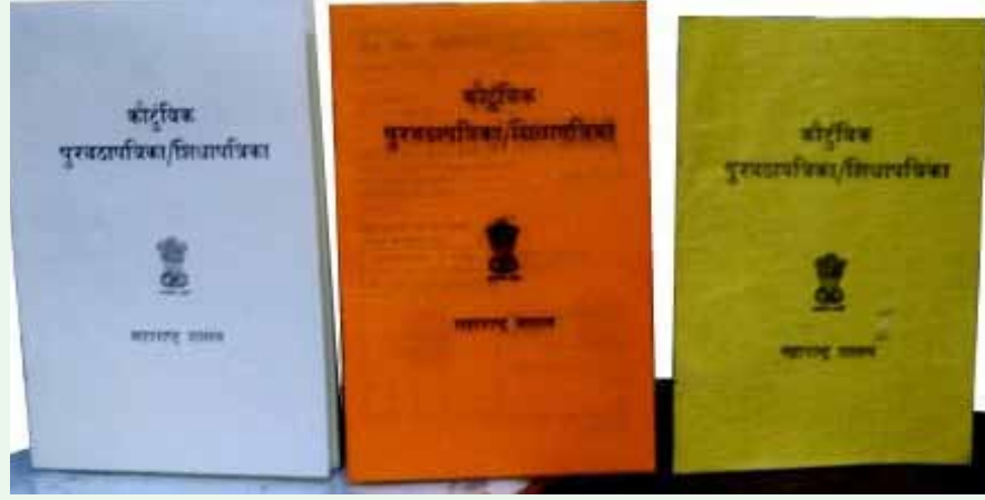
क्रमांकाशी संलग्न करणे आवश्यक आहे. दोन्ही योजना एकत्रितपणे राबवण्याचा घेतला होता

कार्डशी संलग्न करून घेण्याच्या सूचना दिल्या आहेत. या सूचनेनंतर आता पांढऱ्या रंगाची शिधापत्रिका असणाऱ्यांनाही जनआरोग्य योजनेचा लाभ मिळणार असल्याचे स्पष्ट झाले आहे. शिधापत्रिका आधार क्रमांकाशी संलग्न करण्याची सूचना : महाराष्ट्र सरकारच्या अन्न, नागरी पुरवठा व ग्राहक संरक्षण मंत्रालयाने नुकताच एक आदेश जारी केला आहे. या आदेशानुसार शुभ्र शिधापत्रिका आधार क्रमांकाशी संलग्न करून घेण्याची कार्यवाही चालू करावी, असा आदेश सर्व जिल्हा पुरवठा अधिकारी, सर्व अन्नाधान्य वितरण अधिकारी तसेच उपनियंत्रक शिधावटप मुंबईच्या विभागांना तशा सूचना दिल्या आहेत. शुभ्र शिधापत्रिकाधारक कुटुंबांना महात्मा ज्योतिराव फुले जनआरोग्य योजनेचा लाभ देण्याकरिता आयुष्यमान कार्ड निर्माण करण्यासाठी शिधापत्रिका आधार