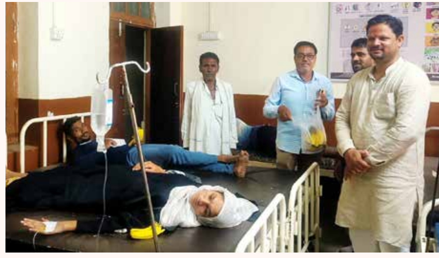
हृदयरोग, मूत्ररोग, मेंदुविकार, प्लॉस्टिक सर्जरी, रेडिओलॉजी आणि कर्करोग अशा विविध रुग्णांचा