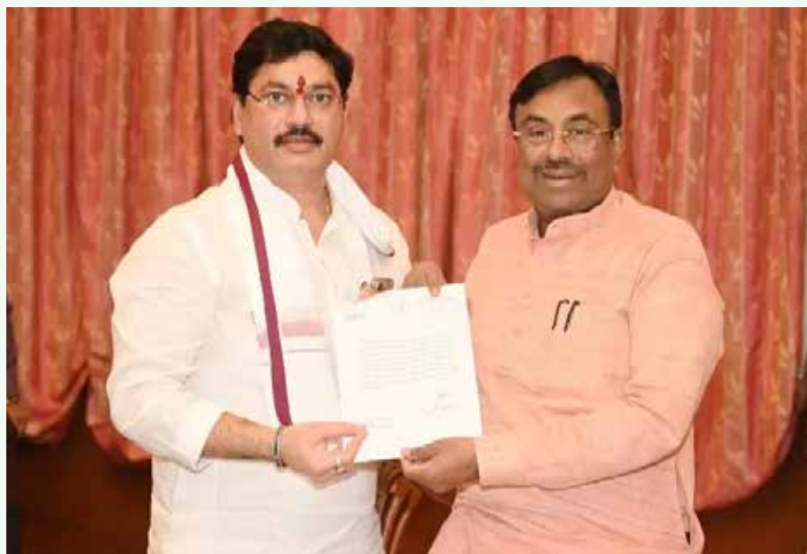
शेतकऱ्यांना दिलासा द्यावा. यासोबतच दिलेल्या दुस-या निवेदनात मुनगंटीवार यांनी पीक विमा

मध्ये चंद्रपूर जिल्ह्यातील 3 लाख 50 हजार 969 शेतकऱ्यांनी प्रधानमंत्री पिक विमा योजनेअंतर्गत पिक विमा काढला होता. खरीप हंगाम सन 2023 - 24 मध्ये सोयाबीन वरील "थेलो मोडॅक व बुरशीजन्य रोगामुळे सोयाबीन पिकाचे नुकसान झाले होते. तसेच अवकाळी पावसामुळे कापसाचे नुकसान होऊन उत्पादन घटले होते. त्यामुळे जिल्ह्यातील शेतकरी हवालदिल झाला. या शेतकऱ्यांना दिलासा देण्यासाठी पावले उचलणे भाग आहे. यासंदर्भात दिलेल्या निवेदनात मुनगंटीवार यांनी म्हटले आहे की, पिक विमा योजनेअंतर्गत चंद्रपूर जिल्ह्यातील शेतकऱ्यांना 91.62 कोटी रुपये प्राप्त होणे अपेक्षित होते. त्यापैकी केवळ 40.31 कोटी रुपये देण्यात आले असून उर्वरित 51.31 कोटी रुपये पीक विम्याची रक्कम पिक विमा कंपन्यांकडून प्राप्त झालेली नाही. सद्यस्थितीत खरीप हंगाम 2024 मध्ये शेतकऱ्यांची पेरणी सुरू झाली असून मागील पीक विमा रकमेची मागणी शेतकऱ्यांकडून होत आहे. सदर उर्वरित पीक विम्याचे रक्कम तातडीने जमा होण्यासंदर्भात पीक विमा कंपन्यांना निर्देशित करून