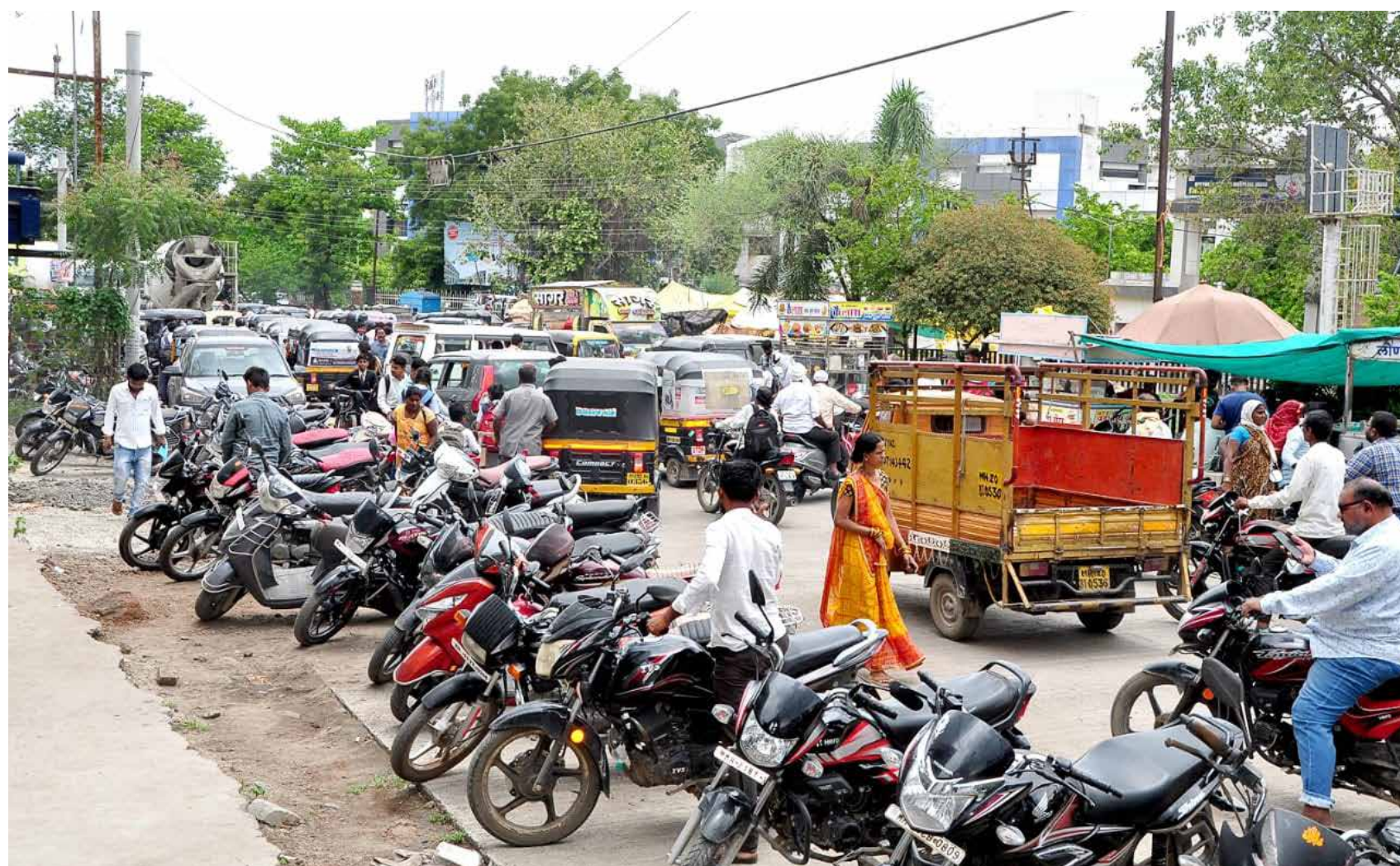
जुना जालना शहरातील महात्मा गांधी यांच्या पुतळ्या जवळील भागात रस्त्याचे काम सुरू असून त्यामुळे ट्राफिक जाम होत आहे.