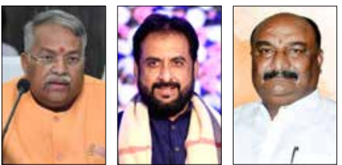
आधुनिक केसरी न्यूज

मनोज जरांगे यांचे मावळे काय निर्णय घेणार याकडे सर्वांचे लागले लक्ष