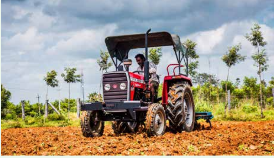
जोमाने येतात. त्यामुळे शेतकरी बैल नांगरणीऐवजी ट्रॅक्टरचा वापर करीत आहे. ट्रॅक्टरला मागणी