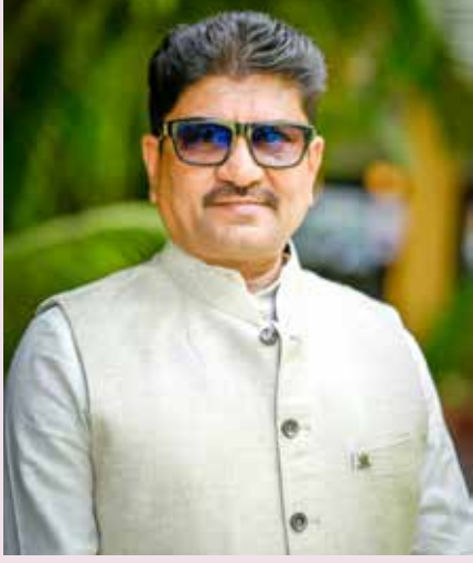
पक्ष ज्या पद्धतीने फोडले, आमदार फोडले आणि चिन्हही पळवल्याने मुख्यमंत्री एकनाथ शिंदे व