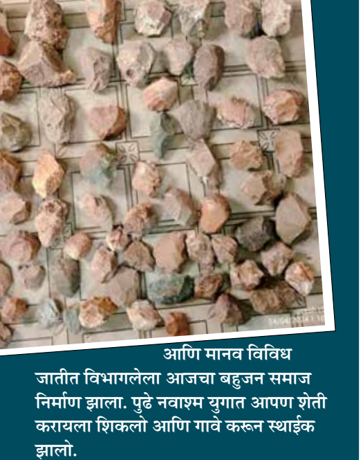
आणि मानव विविधता आहेत. जातीत विभागलेला आजचा बहुजन समाज निर्माण झाला. पुढे नवाश्म युगात आपण शेती करायला शिकलो आणि गावे करून स्थाईक झालो.

अन्नाच्या शोधात भटकणे असा त्यांचा दिनक्रम असे. ज्या ठिकाणी अवजारे बनविण्यासाठी योग्य खडक असेल आणि अन्न उपलब्ध असेल तेथे काही वर्षे राहणे आणि पुढे योग्य ठिकाणी जाणे असे त्यांचे जीवन होते. खर तर बहुजन समाज वंशज- आज जिल्ह्यात जो आदिवासी आणि बहुजन समाज आहे ते अश्मयुगीन मानवांचे वंशज आदिमानवामध्ये सुधा वांशिक विभिन्नता होती हे त्यांच्या आजच्या चेहरेपटीवरून लक्षात येते. पुढे वांशिक सरमिसळ झाली