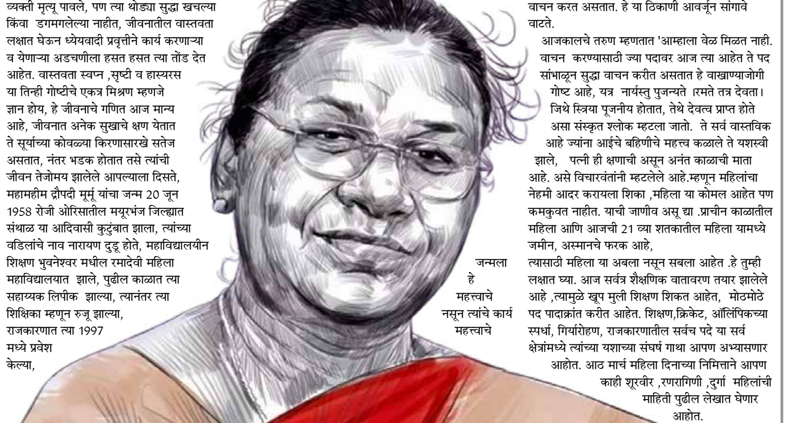
जन्मला हे महत्त्वाचे नसून त्यांचे कार्य महत्त्वाचे

आजकालचे तरुण म्हणतात 'आम्हाला वेळ मिळत नाही. वाचन करण्यासाठी ज्या पदावर आज त्या आहेत ते पद सांभाळून सुद्धा वाचन करीत असतात हे वाखाणायजोगी गोष्ट आहे, यत्र नार्यस्तु पुज्यन्ते रमते तत्र देवता। जिथे स्त्रिया पूजनीय होतात, तेथे देवत्व प्राप्त होते असा संस्कृत श्लोक म्हटला जातो. ते सर्व वास्तविक आहे ज्यांना आईचे बहिणीचे महत्त्व कळाले ते यशस्वी झाले, पत्नी ही क्षणाची असून अनंत काळाची माता आहे. असे विचारवंतांनी म्हटलेले आहे. म्हणून महिलांचा नेहमी आदर करायला शिका, महिला या कोमल आहेत पण कमकुवत नाहीत. याची जाणीव असू द्या. प्राचीन काळातील महिला आणि आजची 21 व्या शतकातील महिला यामध्ये जमीन, अस्मानचे फरक आहे, त्यासाठी महिला या अबला नसून सबला आहेत. हे तुम्ही लक्षात घ्या. आज सर्वत्र शैक्षणिक वातावरण तयार झालेले आहे, त्यामुळे खूप मुली शिक्षण शिकत आहेत, मोटमोठे पद पादाक्रांत करीत आहेत. शिक्षण, क्रिकेट, ऑलिंपिकच्या स्पर्धा, गिर्यारोहण, राजकारणातील सर्वच पदे या सर्व क्षेत्रांमध्ये त्यांच्या यशाच्या संघर्ष गाथा आपण अभ्यासणार आहोत. आठ मार्च महिला दिनाच्या निमित्ताने आपण काही शूरवीर, रणरागिणी, दुर्गा महिलांची माहिती पुढील लेखात घेणार आहोत.