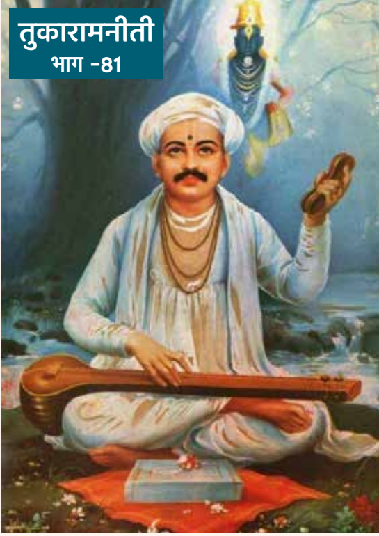
तुकारामनीती भाग -81

चौकट मोडीत काढली होती. असा हा क्रांतिकारी इतिहास सतत स्मरणात ठेवतांना वारकऱ्यांचा समाजजागृतीचा कार्यक्रम सुरूच होता. त्यानंतर संत एकनाथ आणि अलीकडे सतराव्या शतकात तुकोबांसारखा लोककवी पुन्हा उभा राहिला. बिचारा कवी! अनेकांनी वाटेल तसा छळला. घरादाराने परीक्षा पाहिली. काळाचे अनेक आघात केले. तरीही हा कवी कुणापुढे झुकला नाही. लोकांनी मारले तरीही त्यांना प्रतिकार केला नाही. बिचारा एकटाच जाऊन डोंगरावर भजन करत बसायचा. अंभंग लिहित बसायचा. कठीण काळात अहोरात्र जागे राहून येणाऱ्या काळाला कैसं असोनि ठाडकें नेणां । दुःख पावाल पुढिले पेणा ॥१॥ आतां जागा रे भाई जागा रे । चोर निजल्या नाडूनि भागा रे ॥ धु. ॥ आतां नका रे भाई नका रे । आहे गांठी तें लुटवू