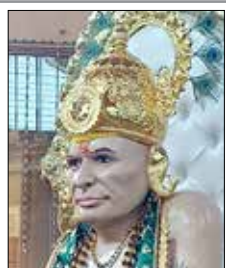
गुरुमाऊली परमपूज्य अण्णासाहेब मोरे, दिंडोरी (नाशिक)