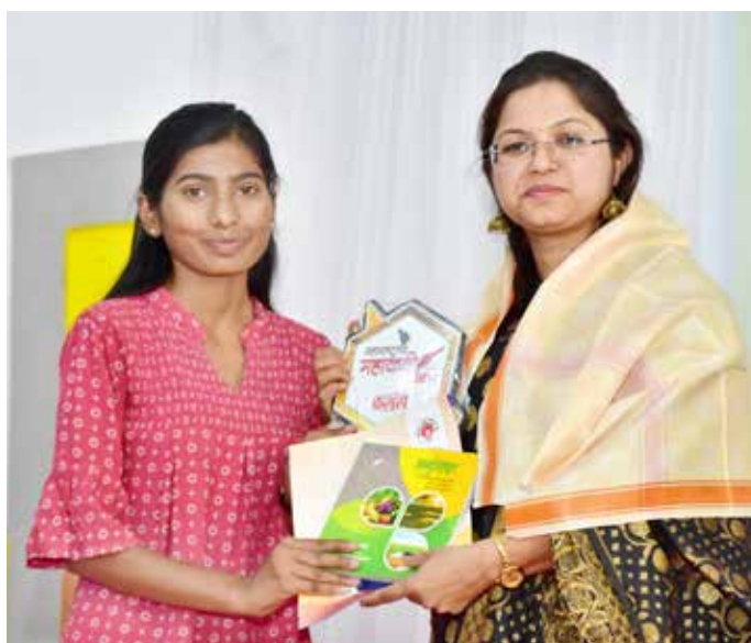
कस्तुरी कुलकर्णी यांचे स्वागत करताना मायावती