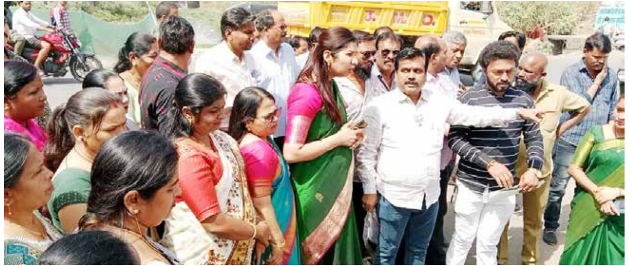
कुत्रिम धोका उद्भवणार नाही. सोबतच भारतीय जनता पक्षाच्या शिष्ट मंडळाने कायमस्वरूपी उपाय योजना करण्यासाठी आयुक्तांनी सदर