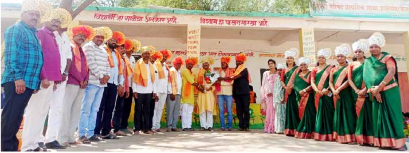
व आंदोरा केंद्रातील सर्व मुख्याध्यापक, शिक्षक व शिक्षिका उपस्थित होते. स्वच्छ शाळा उपक्रमात