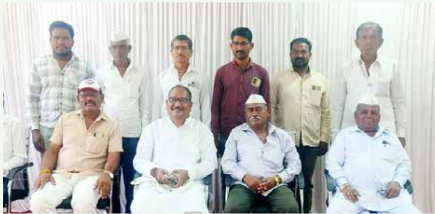
घेऊन पुढील काळात तालुक्यासाठी काम करायचे आहे. कुकडीचे पाणी आले पण पाणी मिळाले का हे कोणी बघत नाही गरजवंत ला पाणी मिळाले नाही एस्टी डेपो करणे अवघड आहे का पण राजकीय पोरचेष्टा चालवली जाते तालुक्यात अधिकारी येण्याची शक्यता नाही पंचड दबावाखाली आहेत.