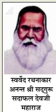
स्वर्वेद रचनाकार अनन्त श्री सद्गुरू सदाफल देवजी महाराज

संदर्भ : हा ग्रंथ तुम्हाला हवा असल्यास वॉट्सअप करा ८५५४८८३१६६.