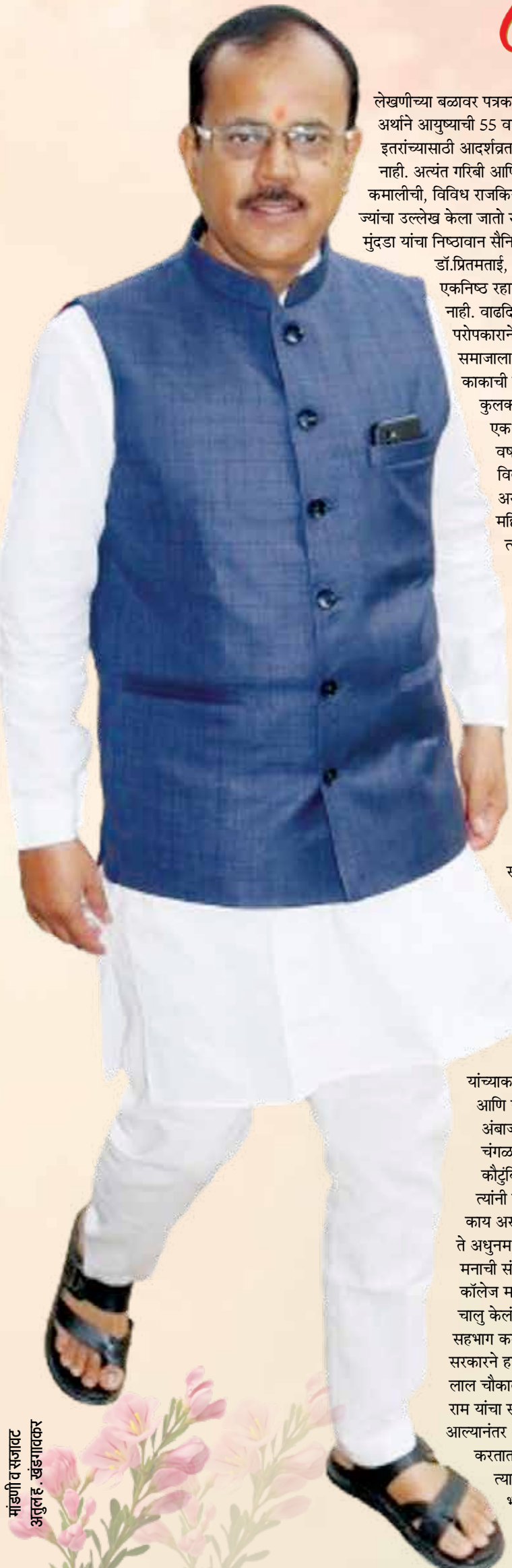
माहिणी व सजावट अतुलहर, खंडगावकर