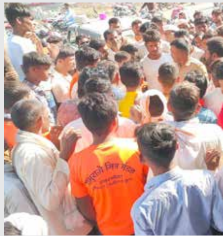
सविस्तर माहिती अशी की 11 मार्च रोजी सकाळी