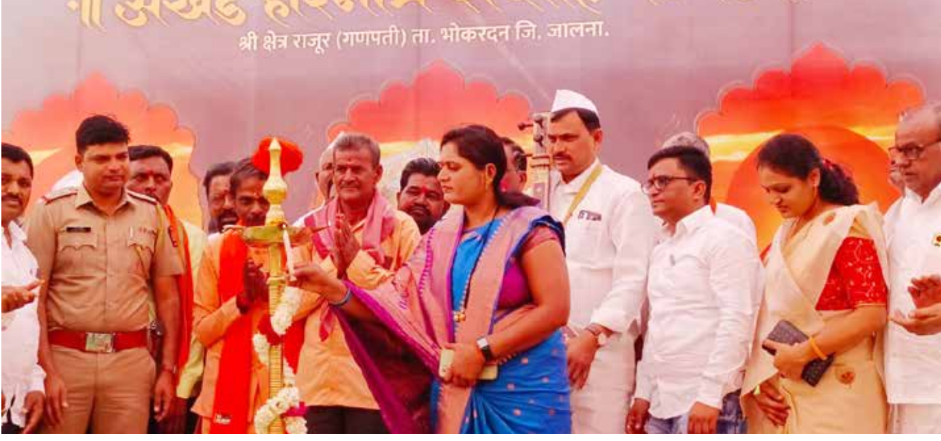
श्री क्षेत्र राजुर (गणपती) ता. भोकरदन जि. जालना.