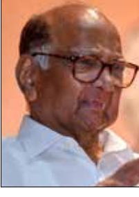
अ ब क ड असे वर्गीकरण करणे गरजेचे असून

नांदेड : राज्यात अनुसूचित जाती आरक्षणामध्ये अ ब क ड करण्यात यावे यासाठी गेल्या ३० वर्षांपासून संघर्ष सुरू असून अनुसूचित जाती संवर्गासाठी असणारे १३ टक्के आरक्षण ५९ उपजातीसाठी असून या आरक्षणाचा लाभ प्रबळ व सक्षम जातींचे घेत असून कमजोर व दुर्लक्षित जाते आरक्षणाच्या लाभापासून वंचित असल्याने अनुसूचित जातीमध्ये समाविष्ट असलेल्या जातींचा विकास समतोल