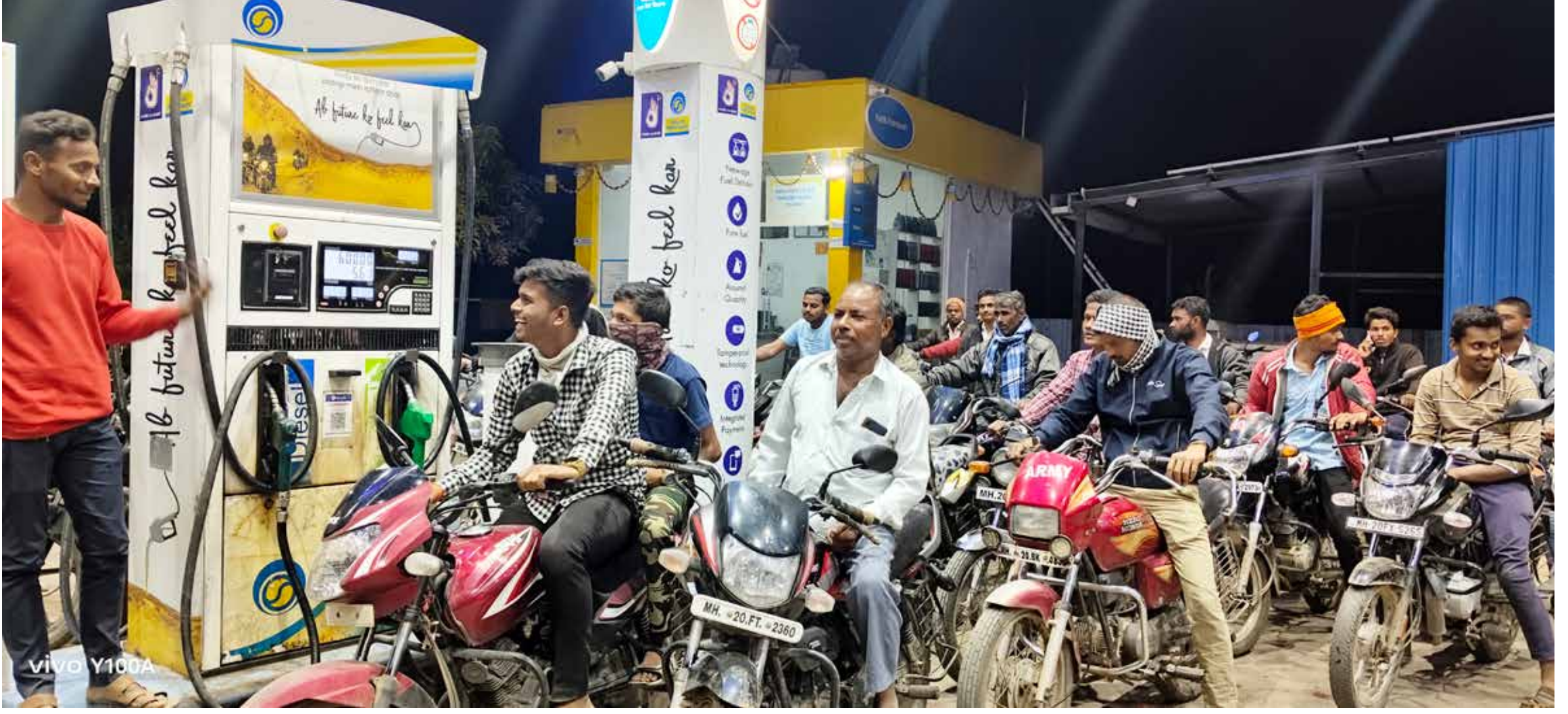
बाजार सावंगी : बाजार सावंगी येथील पेट्रोल पंपावर पेट्रोल, डिझेल भरण्यासाठी लांबच लांब रांगा लागल्याचे दिसून आले. पेट्रोल पंपसाठी पेट्रोल डिझेल पुरवठा करणारे टँकरचालक संपावर जाणार असल्याच्या बातम्यांमुळे पेट्रोल डिझेल भरण्यासाठी वाहनधारकांची झुंबड उडाली. ग्रामीण भागात पेट्रोल पंपवर कधी नव्हे ती एवढ्या प्रचंड मोठ्या प्रमाणात वाहनांची गर्दी झाली होती. रात्री उशिरापर्यंत वाहनांची गर्दी होती.