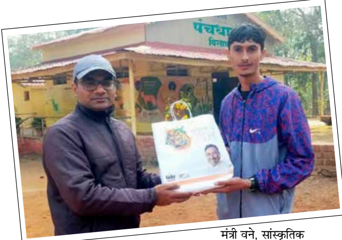
मंत्री वने, सांस्कृतिक

चंद्रपूर : दि. २६ ते ३१ डिसेंबर या कालावधीत विसापूर येथील क्रीडा संकुलमध्ये झालेल्या ६७ व्या राष्ट्रीय क्रीडा स्पर्धेत २८ राज्य व केंद्रशासित प्रदेशातील १५५१ खेळाडू व ५०० प्रशिक्षक व व्यवस्थापक सहभागी झाले होते. सुधीर मुनगंटीवार, मंत्री, वने, सांस्कृतिक संचालनालय व मत्स्य व्यवसाय, महाराष्ट्र राज्य यांच्या सूचनेनुसार सहभागी सर्व खेळाडू, प्रशिक्षक व व्यवस्थापक यांना ताडोबा-अंधारी व्याघ्र प्रकल्पाच्या वतीने निशुल्क ताडोबा भ्रमंती करविण्यात आली आहे व ताडोबा वेलकम कोर्ट भेट व आठवण म्हणून देण्यात आली आहे. यामध्ये ताडोबा-अंधारी व्याघ्र प्रकल्पाची T-शर्ट, कॉप, किचेन, ताडोबा माहिती पुस्तिका आणि ताडोबा डायरी मासिक देण्यात आले आहे. ही कोर्ट प्रदान केल्यानंतर सर्व सहभागी खेळाडूंच्या चेहऱ्यावर आनंद द्विगीतीत होता आणि त्यांच्या मनोगतामध्ये याबद्दल त्यांनी व्यक्त केले आहे. दिनांक २५ ते डिसेंबर या कालावधीत सकाळी व दुपारच्या सफारी वेळेस सर्व खेळाडूंच्या सफारी करविण्यात आले आहेत. या खेळाडूंनी ताडोबा जंगल सफारीचा मनमुराद आनंद घेतला आणि वन्यप्राण्यांचे जवळून निरीक्षण करता आले. यामध्ये प्रत्यक्षात सर्वांनी प्रथमच वाघ पहिला आणि विशेषतः एक वाघ तलवामध्ये