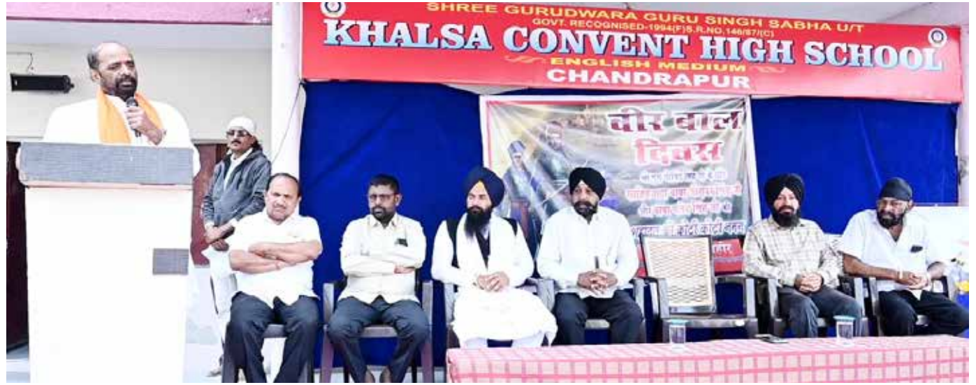
साहीब ग्रंथाचे दर्शन घेतले. यावेळी या दोन्ही वीर बालकांच्या स्मृतीस अभिवादन केले. यावेळी

देशात शासकीय व सामाजिक स्तरावरून हा दिवस साजरा होत असून तो समस्त बालकांना प्रेरणा देणारा असल्याचे सांगत अहीर यांनी गुरु गोविंदसिंह जी यांच्या दोन्ही पुत्रांचे हौतात्म्य पंथ रक्षणार्थ असल्याने त्यांच्या या शौर्याच्या हौतात्म्याचे देशाला अनादीकाळ स्मरण होत राहील मुघलांनी ज्या क्रूरतेने या बालकांना भिंतीत दफन करीत त्यांचे आयुष्य संपविले त्यातून प्रेरणा घेत देशासाठी लढा देणारे अनेक शूरवीर योद्धे निपजतील असेही अहीर यांनी सांगितले तत्पूर्वी हंसराज अहीर यांनी गुरुद्वारात माथा टेकून गुरुग्रंथ