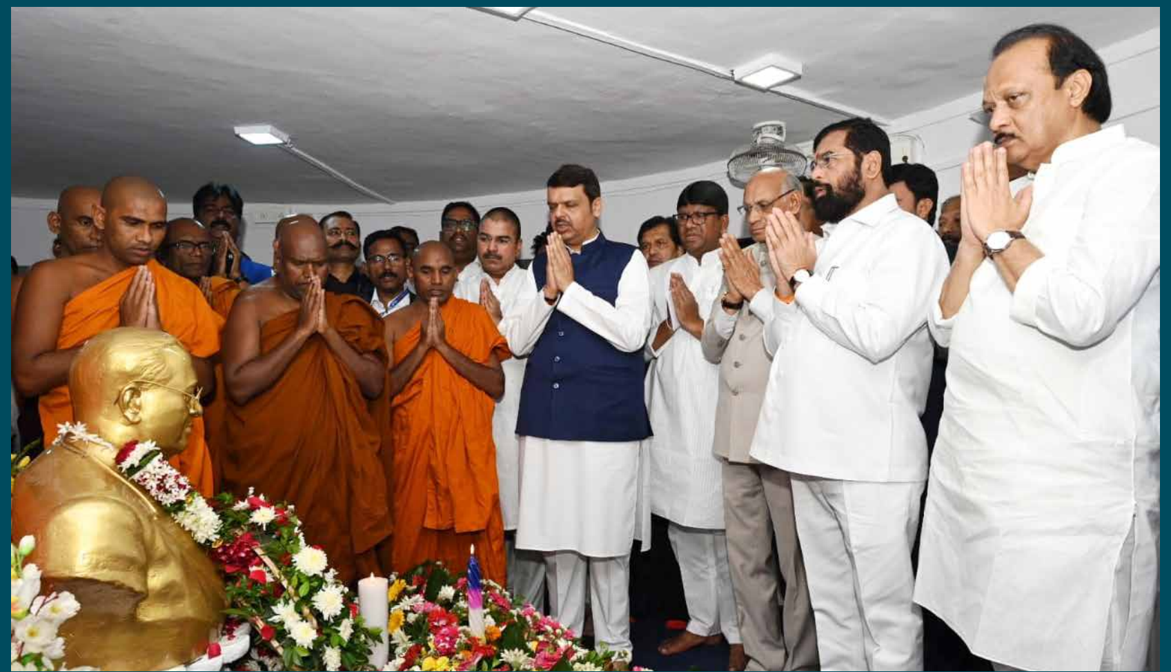
राज्यघटनेचे शिल्पकार, महामानव डॉ.बाबासाहेब आंबेडकर यांच्या महापरिनिर्वाणदिनी दादर येथील चैत्यभूमीवर आज उपमुख्यमंत्री अजित पवार यांनी पुष्पचक्र अर्पण करून भारतरत्न डॉ. बाबासाहेब आंबेडकर यांना अभिवादन केले. यावेळी राज्यपाल रमेश बैस, मुख्यमंत्री एकनाथ शिंदे, उपमुख्यमंत्री देवेंद्र फडणवीस उपस्थित होते.