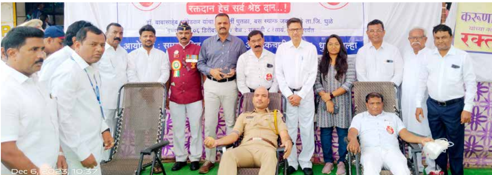
महामानव डॉ.बाबासाहेब आंबेडकर यांच्या ६७ व्या महापरिनिर्वाण दिनानिमित्त समस्त शिव फुले शाहू आंबेडकरवादी समाजतर्फे ब्लड फॉर बाबासाहेब हे स्लोगन घेऊन डॉ.बाबासाहेब आंबेडकर यांच्या धुळे येथील मध्यवर्ती पुतळ्याजवळ महारक्तदान शिबिर चे आयोजन करण्यात आले होते. करुणा सोशल ब्लड डोनर ग्रुप यांच्या वतीने शासकीय वैद्यकीय महाविद्यालय व सर्वोपचार रुग्णालय यांच्या साह्याने सर्व बहुजन समाज पोलीस अधिकारी व कर्मचारी यांनी रक्तदान करून महामानवास एक अनोखी श्रद्धांजली देण्यात आली.