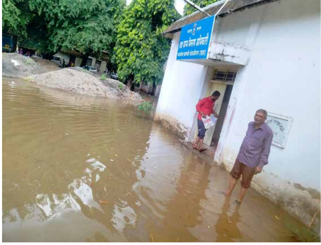
छत्रपती संभाजीनगर जिल्हाधिकारी कार्यालय परिसरातील धान्य वितरण कार्यालयासमोर अवकाळी पावसाचे पाणी साचले आहे. त्यामुळे या परिसराला तलावाचे स्वरूप आले आहे.

● YEAR-03 ● ISSUE-113 ● RNI : MAHMAR/2021/82566 ● PAGE-12 ● PRICE-05