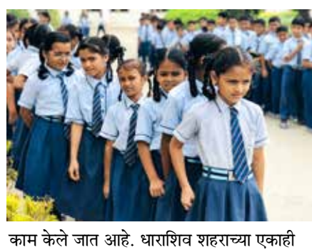
काम केले जात आहे. धाराशिव शहराच्या एकाही