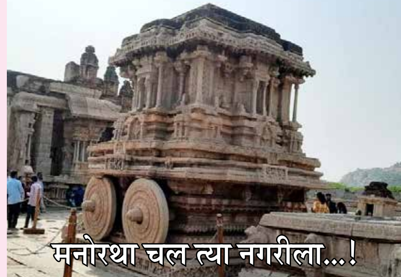
मनोरथा चल त्या नगरीला...!

आक्रमकांनी मूर्तीचे हात तोडलेले दिसतात. पण मूर्ती अतिशय विशाल आणि सुंदर आहे. मूर्तीच्या समोरच एक विशाल अखंड पाषाणातून घडवलेले शिवलिंग आहे. त्याच्या तळाशी कायम पाणी असते. हंपीत राहून पाहावीत अशी अनेक सुंदर स्थळे आहेत. हंपीत फिरताना तुंगभद्रा नदीचे मनोरम दर्शन जागोजागी होते. जवळच एका टेकडीवर अंजनेय हनुमानाचे मंदिर आहे. हे हनुमानाचे जन्मस्थान समजले जाते. याच ठिकाणी श्रीराम आणि हनुमानाची भेट झाली होती असे सांगितले जाते. जवळच एका टेकडीवर जैन मंदिरांचा समूह आहे. आपण बघू तेवढे कमी आहे. येथे पर्यटकांसाठी अनेक हॉटेल्स आहेत. अशाच एका आगळ्यावेगळ्या हॉटेलात आम्ही भोजनाचा आस्वाद घेतला. त्याचे नाव मँगो ट्री रेस्टॉरंट. यात आपल्याला बसण्यासाठी भारतीय पद्धतीची बैठक व्यवस्था आहे. वेळ असेल तर वाचण्यासाठी काही पुस्तके देखील ठेवली आहेत. शाकाहारी पद्धतीचे केळीच्या पानावर वाढलेले उत्कृष्ट जेवण येथे मिळते.