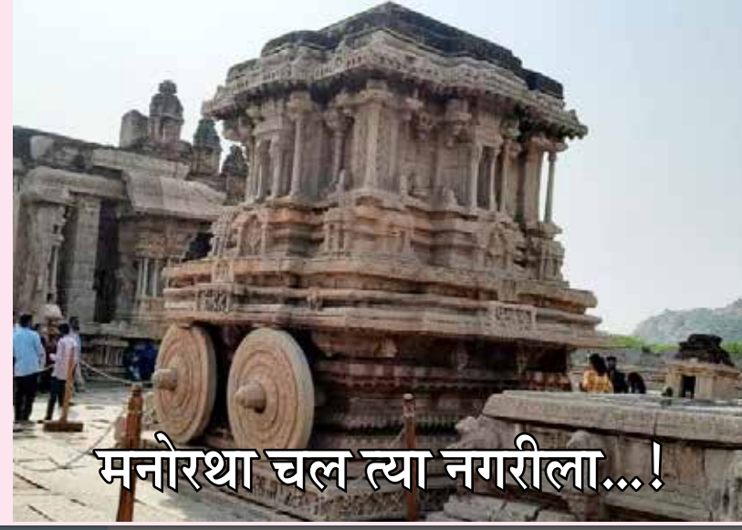
मनोरथा चल त्या नगरीला...!

जाणीव पाहताना होते. या मंदिराचे पूर्वेकडील गोपुर १०५ फूट उंच म्हणजे जवळपास दहा मजली इमारतीएवढे उंच आहे. त्यावर विविध प्रकारच्या मुर्त्या, नक्षीकाम आणि देखावे कोरलेले आहेत. मंदिराच्या मध्यभागी एक विशाल असे प्रांगण आहे. त्यातही अनेक देखणी गोपुरे आहेत. नक्षीकाम केलेले आणि अलंकारांनी सुशोभित केलेले शंभर दगडी खांबे आहेत. अलंकृत असा भव्य नंदी आहे. त्यावर आरूढ अशी गिरिजाशंकराची मूर्ती आहे. राम, विष्णू आणि भगवान शंकरांच्या अवतारांच्या अनेक कथा कोरीव कामातील शिल्पातून साकार झाल्या आहेत. या परिसरात मंद स्वरात दाक्षिणात्य पद्धतीचे सनई चौघड्याचे छान संगीत ऐकायला येते. पूर्वेकडील गोपुरातून आतमध्ये प्रवेश केल्यावर डाव्या बाजूला एका कोपऱ्यात अत्यंत सुशोभित असा एक गजराज आपल्याला दर्शन देतो. अनेक भाविक त्याची पूजा करतात.