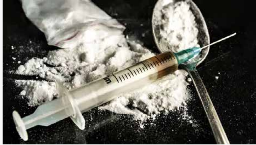
व्यक्तीमध्ये व्यसनासक्ती निर्माण होते. ती व्यक्ती शारीरिक आणि मानसिकदृष्ट्या त्या अमली

गंभीर बाब म्हणजे मोखाडासारख्या दुर्गम भागात कावळपाडा गावानजीक फार्म हाऊसवर हा साठा सापडला. त्याची एकूण किंमत १० लाख रुपयांच्या पुढे नसेल; मात्र याच 'लाखांच्या फार्म हाऊसवर तब्बल ३६ कोटी ९० लाख ७४ हजार आंतरराष्ट्रीय बाजारभावाचे एमडी मेफेड्रान हा अमली पदार्थ सापडला. मुळात या फार्म हाऊससाठीची जागा अवच्या साडेतीन लाखात घेतल्याचे आता समोर येत असून याठिकाणी एक हॉल, बेडरूम किचन असलेले पत्र्याचे घर बांधण्यात आले. मात्र गेल्या दोन वर्षांपूर्वी ड्रग बनविण्यासाठी एक वेगळी छोटी रूम तयार करण्यात आली होती. त्या रूममध्येच हे ड्रग बनवणारे आरोपी कधी यायचे, किती दिवस राहायचे याची जराही भगक स्थानिकांना नव्हती. एमडी माणसाला थेट सारे विसरवते, संपवते! कोणत्याही अमली पदार्थाच्या सेवनामुळे त्या