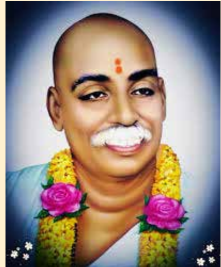
कर्मयोगी समाज महाराजांना अभिप्रेत होता. त्यांच्या गुरुदेव सेवा मंडळाने वऱ्हाडातल्या खेड्या

देशात जाऊन त्यांनी विश्वबंधुत्वाचा संदेश दिला. भारत हा खेड्यांचा देश आहे, हे लक्षात घेऊन ग्रामविकास झाला तरच राष्ट्राचा विकास होईल, अशी तुकडोजी महाराजांची श्रद्धा व विचारसरणी होती. समाजातल्या सर्व घटकांतील लोकांचा उद्धार कसा होईल, याविषयी त्यांनी अहर्निश चिंता केली. ग्रामोन्नती व ग्रामकल्याण हा त्यांच्या विचारसरणीचा जणू केंद्रबिंदूच होता. खरे नाम निष्काम ही ग्रामसेवा । झट्टू सर्व भावे करू स्वर्ग गावा ।। कळो हे वळो, देह कार्यी पडू दे । घडू दे प्रभो, एवढे हे घडू दे ।। याप्रमाणे महात्मा गांधींच्या स्वप्नातील ग्रामस्वराज्यानुसार ग्रामरचना करण्याचा प्रयत्न तुकडोजी महाराजांनी केला. व्यक्ती व्हावी कुटुंबपूरक । कुटुंब व्हावे समाज पोषक । तैसेचि ग्राम व्हावे राष्ट्र सहाय्यक । राष्ट्र विश्वा शांतीदायी ।। आपल्या वाट्याला आलेली कामे निष्ठेने करणारा