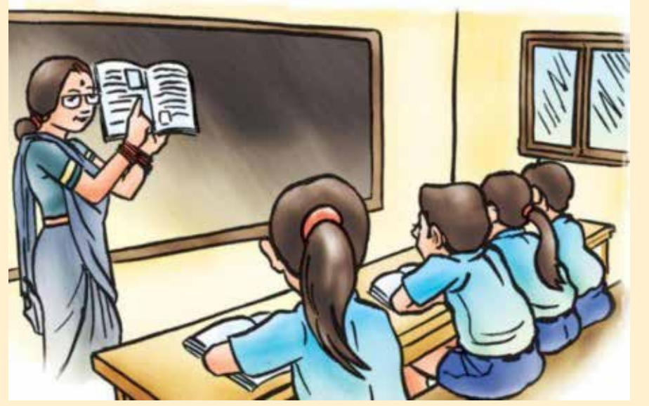
आपण सर्व शिक्षकांनी मिळून असेच प्रभावी कार्य करत राहू आणि देशाचा मान सन्मान वाढवू.