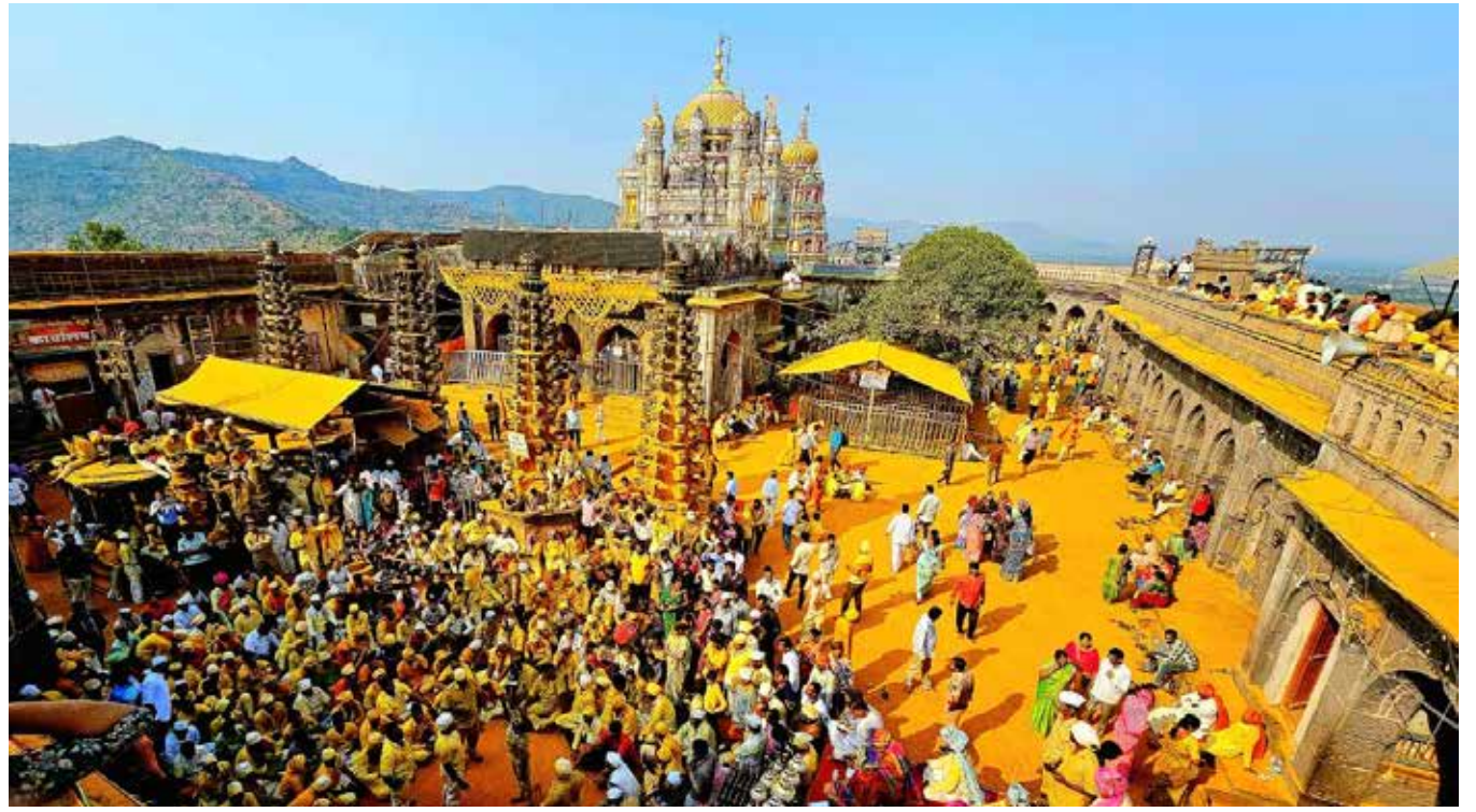
दिवाळी सुटीनिमित्त जेजुरीगडावर भाविकांची प्रचंड गर्दी- महाराष्ट्राचे लोकदैवत जेजुरी खंडोबा देवाला दिवाळी सुटीनिमित्त लाखो भाविकांनी दर्शनाकरिता गर्दी केली होती यामुळे संपूर्ण गड परिसर भाविकांनी फुलून गेला होता.