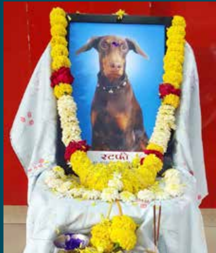
स्तफीला मिळत होते. स्तफीला वेगळी अशी खोली नव्हती ती बेडरूममध्ये बेडवरच झोपून