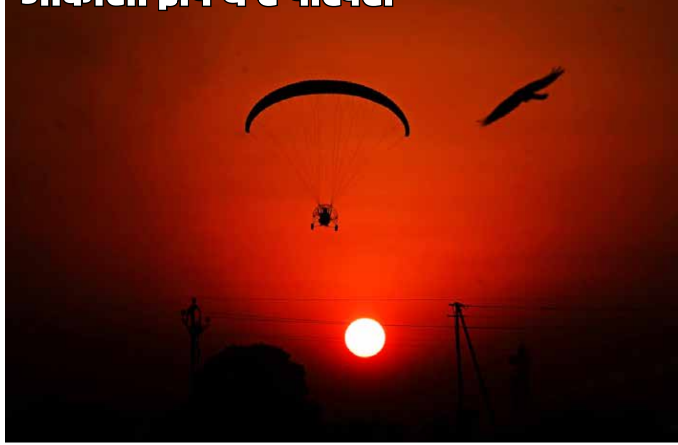
जयात्री क्षितिजावर पसरलेला लालिमा आणि त्यातच येथे नव्याने पर्यटक, भाविकांना आकाशातून जेजुरी दर्शन परामोटरिंग उड्डाण होत असतानाचे विहंगम दृश्य मानवी तंत्रज्ञान आणि निसर्ग रंगाची अनुभूती.