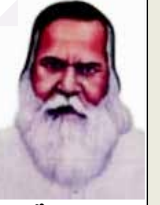
स्वर्वेद रचनाकार अनन्त श्री सद्गुरु सदाफल देवजी महाराज

संदर्भ : हा ग्रंथ तुम्हाला हवा असल्यास वॉट्सअप करा ८५५४८८३१६६.