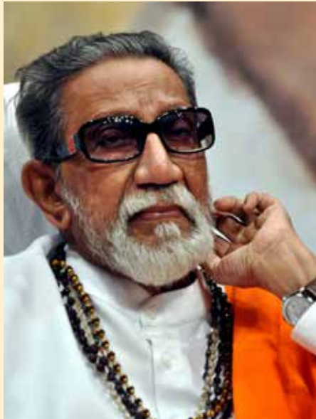
व शिवसैनिक "कोण आला रे, कोण आला? महाराष्ट्राचा वाघ आला!" अशा आरोब्या टोकत त्यांच्या प्रतिमेसमोर नतमस्तक होतात.

माहेरघर म्हणून ओळखल्या जाणाऱ्या पुणे शहरात दि.२३ जानेवारी १९२६ रोजी झाला. हिंदूंच्या पूजापाठ व अंधश्रद्धांवर कडाडून प्रहार करणारे प्रबोधनकार केशव सीताराम ठाकरे हे त्यांचे वडील आणि रमाबाई या त्यांच्या प्रेमळ मातोश्री होत. महाराष्ट्राचे सांप्रत मुख्यमंत्री मा.उद्धवजी ठाकरे हे त्यांचे सुपुत्र तर महाराष्ट्र नवनिर्माण सेनेचे अध्यक्ष मा.राजजी ठाकरे हे त्यांचे पुतणे आहेत. महाराष्ट्रातील राजकारणात बाळासाहेबांचा प्रचंड दबदबा निर्माण झाला होता. शुणका भाकर केंद्रांची योजना, वृद्धाश्रमांची साखळी, वृद्धांना सवलती, झोपडपट्टी वासीयांना घरे, मुंबई-पुणे द्रुतगती मार्ग, मुंबईतील उड्डाणपूल, बॉम्बेचे मुंबई नामकरण अशा अनेक योजना-प्रकल्पांची मूळ संकल्पना ही त्यांचीच होती. व्हॅलेंटाईन डेसारख्या पाश्चिमात्य उत्सवांना विरोध, परप्रांतीयांच्या तसेच बांगलादेशींच्या विरोधातील आंदोलने यांमागचा विचारही त्यांचा होता. त्यामुळेच त्यांना महाराष्ट्राचा वाघ असे संबोधले जात होते. आज त्यांच्या जयंतीच्या मंगल प्रसंगी समस्त कार्यकर्ते