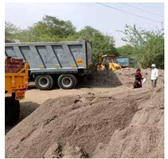
एक ट्रॅक्टर धारक संध्याकाळी आठ नऊ वाजेच्या दरम्यान चोरटी वाळु वाहतूक करत असताना त्याचा पाठलाग करून ताब्यात घेतल्याचे निदर्शनास आले. महसूल व पोलीस प्रशासन वाळु ला घेवून सतर्क झाल्याने सद्या वाळु मिळे नसी झाली आहे व सरकारची वाळु डेपो घोषणा फक्त घोषणाच उरत असल्याने वाळुला घेवून नागरिक तथा बांधकाम करते परेशान झाले आहेत.

बाजार सावंगी : खुलताबाद तालुक्यात वाळु डेपोचा कोठेच पत्ता नसुण वाळु डेपोची नागरिकांतून प्रतीक्षा आहे तर सरकारची ती घोषणाच उरत असुण वाळू साठी नागरिकांची भटकती सुरु आहे. चोरीची नव्हे तर सरकार कडून कमी दरात वाळु खरेदी करण्यासाठी सरकारने घोषणा केली खरी परंतु अद्याप तालुक्यात किंवा मोठ मोठ्या गावात वाळु डेपोचा कोठेही थांगपत्ता नाही. व नागरिकांना बांधकामासाठी वाळु मिळत नाही. त्यामुळे अनेक बांधकामे ठप्प बंद पडून आहे. तर सर्वसामान्यांच्या बांधकामा साठी चोरटी वाळु खरेदी करणे आवक्या बाहेर असल्याने सर्वसामान्य जागीच चुरमुट्या देवून आहे. तर चोरट्या मार्गाने येणारी वाळु रात्री अपरात्रीच मिळते. चोरटी वाळु वाहतुक करणारे नाले खोले नद्या कोरणे कारून माती मिश्रीत वाळु चढ्या भावाने विक्री करत असल्याने बांधकाम करणाऱ्यांना ती वाळु परवडत नाही. परंतु ना इलाजस्तव त्याचा वापर सर्वसामान्य करत आहे. त्यात महसूल व पोलीस प्रशासन चोरटी वाळु वाहतूक करणाऱ्यांवर टिपून बसल्याने त्यांचेही धाबे दणाणले आहे. गत आठवड्यातच व त्यापूर्वी महसूल प्रशासनाकडून दंडात्मक कार्यवाही झाल्याने चोरटी वाळु वाहतूकदार जागृत झाले आहे. महसूल व पोलीस प्रशासनाचे कोटून व कसी कार्यवाही होईल याचा अंदाज येत नसल्याने ते धाबरून आहे. गत आठवड्यात