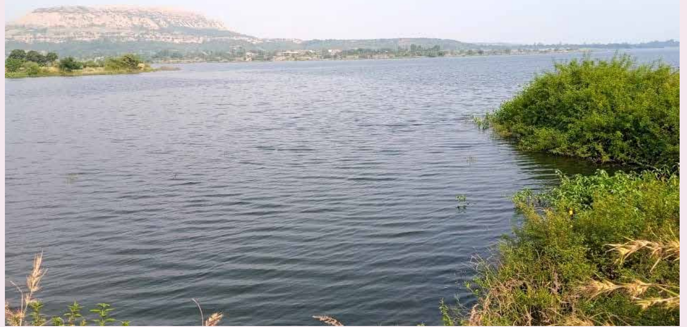
व्यावसायिक नागरिक या धरणातील झिंगे व मासे जास्त हाती लागण्यासाठी जलाशयात विषारी द्रव

जातो. लाखो लोकांची तहान भागवीत असून या सर्व प्रकारामुळे मुंबईतील नागरिकांचे आरोग्य धोक्यात येण्याची शक्यता नाकारता येत नाही. याबाबत शेवगेडांग, म्हसुली येथील स्थानिक नागरिकांनी जलसंपदा विभागाकडे अनेक वेळा तक्रार करून ही जलसंपदा विभाग लक्ष देत नसल्याने मच्छीमारांचे चांगलेच फावत आहे. धरणाच्या पाण्यात विषारी द्रव्य टाकणाऱ्या संबंधित व्यक्तींवर कठोर कारवाई करण्यात यावी अशी मागणी येथील ग्रामस्थांनी केली आहे. संबंधित व्यक्तींवर लवकर कारवाई न केल्यास आमरण उपोषणाचा इशारा येथील ग्रामस्थांनी दिला आहे. इगतपुरी हा उत्तर महाराष्ट्रातील सर्वाधिक धरणाचा तालुका म्हणून प्रसिद्ध आहे. या तालुक्यात ब्रिटिश काळातील दारणा धरण, तसेच मुकणे, भाम, भावली, वाकी खापरी, कडवा आदी लहान मोठी धरणे आहेत. या धरणांमध्ये विषप्रयोग केल्याच्या घटना मागील काही वर्षांत झालेला आहे. जायकवाडी ला पाणी सोडण्यास स्थगिती आल्यामुळे सर्वच धरणे तुडुंब भरलेले असून या सर्वच धरणात झिंगा, वाम, रऊ, कोंबडा, मुरा आदी असंख्य जातीच्या प्रजाती बहुसंख्येने बघायला मिळतात. तथापि काही