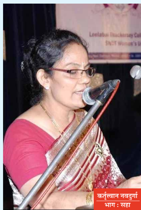
कर्तृत्वान नवदुर्गा भाग : सहा

त्यांनी आयसीयू मध्ये कामाच्या स्वरूपाचा अनुभव व त्यात प्राविण्य नानावटी हॉस्पिटल तसेच भाटिया हॉस्पिटल येथे मिळविले. आता विदेशातील कामाचा अनुभव घेण्यासाठी त्या सौदी अरेबिया येथे पोहोचल्या आणि किंग फहद युनिव्हर्सिटी हॉस्पिटल, अल-खोबर, सौदी अरेबिया मध्ये थोडी थोडकी नवे तर चक्क आठ वर्षे काम केले.कुटुंब, मुलं या सर्व जबाबदाऱ्या पार पाडत आपल्या कामावर निस्सीम प्रेम असल्या कारणाने अतिदक्षता विभागातील त्यांचा कामाचा अनुभव एवढा दांडगा झाला त्यांच्या अनुभवाची भर पडत गेली आणि त्या एक प्रकारे