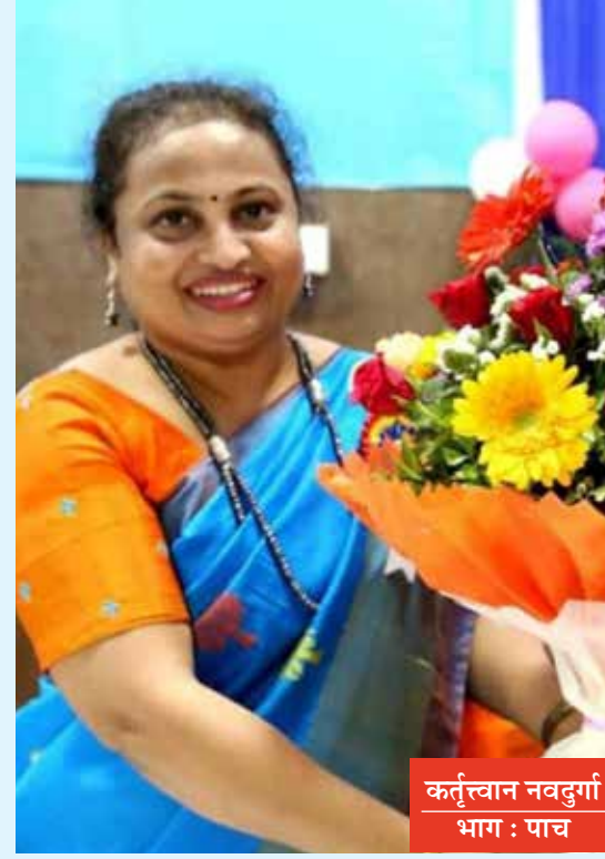
कर्तृत्वान नवदुर्गा भाग : पाच

भरभक्कम साथ मिळाली. त्यामुळे नर्सिंग क्षेत्रातील पदविका हा अभ्यासक्रम म्हणजेच एमएससी पूर्ण करता आला.२०१४ ला हिमालय पुल कोसळून ३ परिचारिका मृत पावल्या