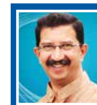
रणधुमाळी वाशीम लोकसभा