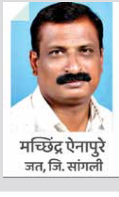
मच्छिंद्र ऐनापुरे जत, जि. सांगली