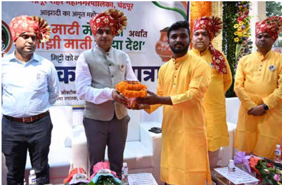
नेण्यात येणार असून तदनंतर शासनाच्या माध्यमातून ०१ नोव्हेंबर, २०२३ रोजी दिल्ली येथे