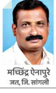
मच्छिंद्र ऐनापुरे जत, जि. सांगली