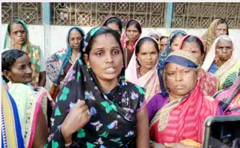
ऑल इंडिया पॅथर सेना धुळे जिल्हा युनिटला कळल्याने धुळे जिल्ह्यातील पदाधिकाऱ्यांनी पारोळाकडे धाव घेतली व मोडाले पिंपरी

जळगाव : पारोळा तालुक्यातील मोडाले पिंपरी येथील आदिवासी आणि बौध्द समाजावर बहिष्कार टाकला आहे असा आरोप स्थानिक गावकऱ्यांनी केला आहे. गावातील काही गाव गुंडांवर अॅट्रॉसिटी केस केली म्हणून आदिवासी व बौद्ध समाजावर बहिष्कार टाकण्याची घटना उघडकीस आली आहे आदिवासी व बौद्ध समाजाच्या लोकांना पिठाची गिरणी वर दळण दळू दिले जात नाही दूध दिले जात नाही किराणा दिला जात नाही व कामावर घेऊन जात नाही व त्यांना पारोळा पर्यंत यायला प्रवासी रिश्कत बसू दिला जात नाही व त्यांना सांगतात तुम्ही केस माघारी घ्या नाहीतर तुम्हा महार भिलाना गावातून हाकलून लावू अॅट्रॉसिटी अॅक्ट मधील 25 आरोपींना अद्यापही अटक केलेली नाही ही माहिती