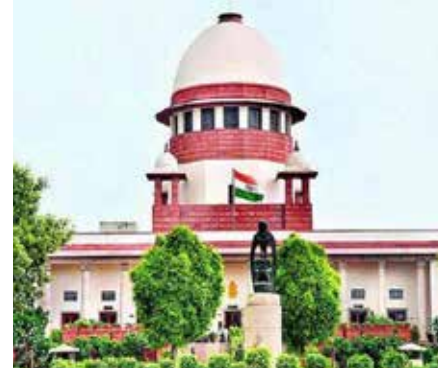
म्हणाला होतात योग्य कालावधीत निर्णय द्यावा. तुमच्या निकालानंतर तीन वेळा त्यांना अर्ज केला

आमदारांच्या अपात्रतेसंबंधित निर्देश देताना यावर पुढच्या दोन सुनावणीपूर्वी नेमकीस काय कारवाई केली याची माहिती अध्यक्षांनी द्यावी. अशा पद्धतीने अनिश्चित काळ काम करू शकत नाही, किती वेळेत काम करणार याचे टाईम टेबल विधानसभा अध्यक्षांनी द्यावे, असेही निर्देश सर्वोच्च न्यायालयाने दिले आहेत. ठाकरे गटाच्या वतीने युक्तिवाद करताना कपिल सिब्बल म्हणाले की, हा खूप गंभीर विषय आहे. पाच अपात्रता याचिका दाखल केल्या आहेत. 2022 मध्ये या प्रकरणी 12 जुलै 2022 पर्यंत उत्तर द्यायचे होते. पण काहीच घडले नाही. या तारखेपर्यंत नोटीस इशू झालेली नाही. तुम्ही