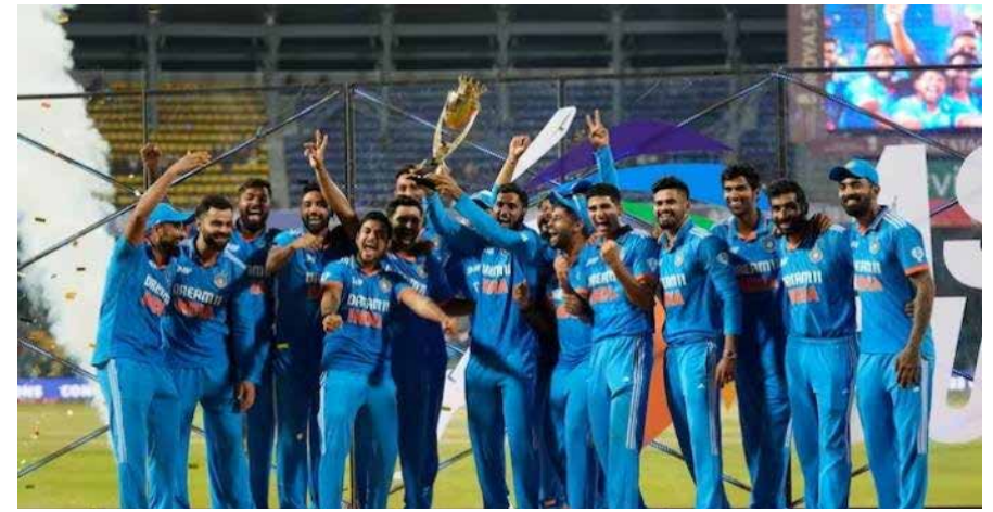
नाव कोरत आपण आशियाचा राजा आहोत हे सिद्ध करून आता जग जिंकण्यास तयार असल्याचे दाखवून दिले आहे. आज आशिया जिंकला उद्या अवघे विश्व ताब्यात घेण्याकडे कूच करणाऱ्या भारतीय संघाचे मनापासून अभिनंदन आणि संघाला विश्वचषकासाठी शुभेच्छा!

विश्वचषकात तर तो भारताचा एक्स फॅक्टर ठरणार आहे. ही स्पर्धा भारतीय संघासाठी खूप महत्वाची आहे हे मी माझ्या आशिया चषक ; विश्वचषकाची रंगीत तालीम या लेखात नमूद केले आहे. ज्याप्रमाणे मुख्य परिक्षेपूर्वी पूर्व परीक्षा असते ही पूर्वपरीक्षा म्हणजे मुख्य परिक्षेची रंगीत तालीम असते. मुख्य परीक्षेसाठी विद्यार्थ्यांची किती तयारी झाली हे पूर्व परीक्षेद्वारे जोखता येते. आशिया चषकही भारतासाठी विश्वचषकाची पूर्वपरीक्षा होती आणि या पूर्व परीक्षेत पैकीच्या पैकी गुण मिळवून भारताने आपण विश्वचषकासाठी तयार असल्याचे जगाला दाखवून दिले आहे. पुढील महिन्यात पाच तारखेपासून विश्वचषकाला प्रारंभ होणार आहे. मागील बारा वर्षांपासून भारताने ही स्पर्धा जिंकली नाही आता आशिया चषक जिंकल्याने भारतच विश्वचषक जिंकणार याची खात्री देशातील १४० कोटी जनतेला पटली आहे. भारतीय संघानेही आशिया चषकावर