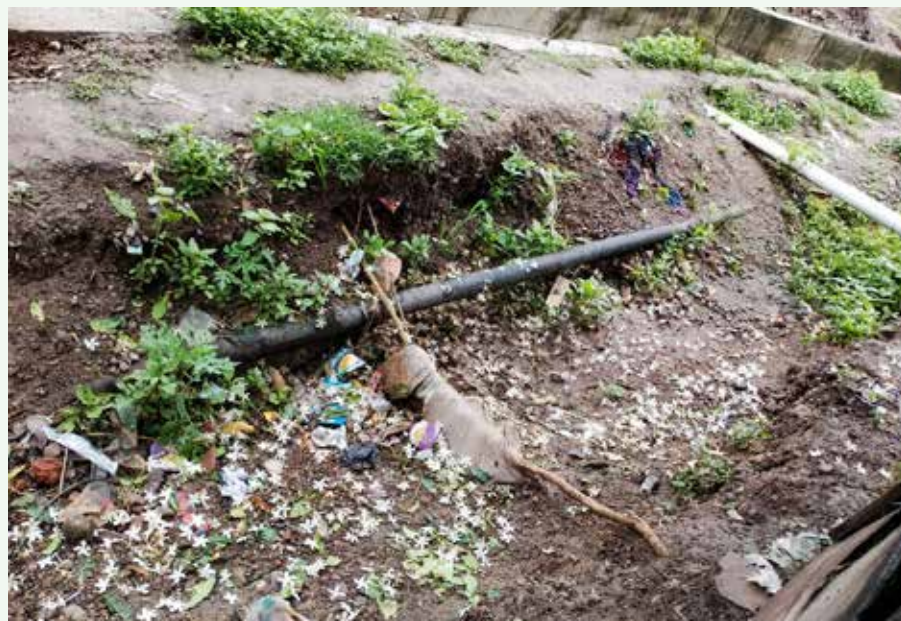
टाकायला सांगा. आम्ही फक्त मुरुमच टाकू तुम्हाला तो उचलून सदर खड्डा बुजवावा लागेल. मजुराचे आम्ही सांगू शकत नाही आणि त्यांचे पैसे पण देवू शकत नाही. अशा शब्दात त्यांनी माझे सांत्वन

लोकांची घरे आहेत. २२ जुलैच्या महापूराने अनेकांच्या घरात पाणी शिरले. त्यामुळे मोठ्या प्रमाणावर त्या लोकांचे नुकसान झाले. त्या महापूराने नाल्याच्या काठाला लागूनच असलेल्या रस्त्यावरून त्या लोकांना जावे लागते. पुराच्या पाण्याने तीथे मोठा खड्डा पडला असून लोकांचे येणे जाणे तेथू बंद झाले आहे. पुराने खड्डा पडल्याने १५० गावांची जळगाव शहरातील पाईप लाईन उघडी पडली आहे. त्या पाईप लाईनला सुद्धा धोका निर्माण झाला आहे. एखाद्या माथेफिरू इस्माने जर तो पाइप फोडला तर संबंधित विभाग आणि लोकांना नाहक त्रास भोगावा लागेल. तो खोल खड्डा बुजवण्यासाठी महिलांनी जळगाव जामोदचे सी.ओ. साहेबांना निवेदनही दिले आहे. मी पत्रकार या नात्याने त्यांना याबाबत फोन करून माहिती दिली. खड्डा पडलेल्या जागेचा विडिओ काढून साहेबांच्या व्हाट्सएपवर पाठवला व प्रत्यक्ष जावून भेटलोही. साहेबांनी तो खड्डा बुजवण्यासाठी मुरमाच्या जेवढ्या ट्रीपा लागतील तेवढ्या आम्ही पाठवतो. तुम्ही त्या परिसरातील लोकांना सांगून जिथे खड्डा पडलेला आहे तिथे त्यांना