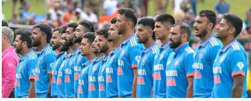
आधुनिक केसरी न्यूज

मुंबई : बीसीसीआय निवड समितीने आगामी आयसीसी वनडे वर्ल्ड कप २०२३ साठी टीम इंडियाची घोषणा केली आहे. बीसीसीआयने वर्ल्ड कपसाठी मुख्य संघात १५ खेळाडूंचा समावेश केला आहे. रोहित शर्मा वर्ल्ड कपमध्ये टीम इंडियाचं नेतृत्व करणार आहे. टीम इंडिया श्रीलंकेत आशिया कप २०२३ स्पर्धा खेळत आहे. श्रीलंकेत बीसीसीआय निवड समितीचे अध्यक्ष अजित आगरकर आणि कॅप्टन रोहित शर्मा यांच्यात बैठक पार पडली. या बैठकीनंतर आगरकर आणि रोहित या दोघांची पत्रकार परिषद पार पडली. आगरकर यांनी या पत्रकार