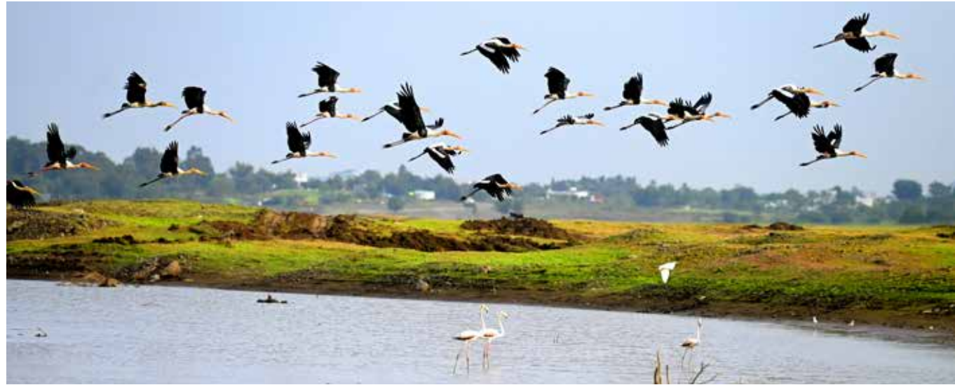
दुष्काळी पुरंदरच्या मल्हारसागर धरणावर विदेशी फ्लेमिंगो पक्ष्यांचे आगमन झाले आहे. सध्या पुरंदर तालुक्याच्या जेजुरी कऱ्हा नदीवरील मल्हारसागर धरणावर पाणीसाठा अल्प प्रमाणावर असताना देखील युरोप खंडातून लाखो मैलाचा प्रवास करित फ्लेमिंगो पक्षी दाखल झाले असून चित्रबलक स्पिन बुल ग्रेहौन पक्षीही दिसू लागले आहेत.

यांनी म्हटले आहे. विमा कंपनीच्या माध्यमातून एक रुपयात पीक विमा देण्याचा निर्णय सरकारने घेतला होता. त्यामुळे आशा निर्माण झाली होती. मात्र आता शेतकऱ्यांना त्याचा फायदा मिळत नसल्याचा आरोप शरद पवार यांनी केला आहे. ही परिस्थिती केवळ जळगाव जिल्ह्यातील नव्हे तर मराठवाड्यासह अनेक ठिकाणी हीच स्थिती असल्याचे शरद पवार म्हणाले. विमा कंपनीमुळे शेतकरी संकटात सापडला असून त्याकडे सरकारने लक्ष देण्याची आवश्यकता असल्याचे शरद पवार साहेब यांनी म्हटले आहे. कापूस उत्पादक शेतकऱ्यांना हवी तशी आवश्यक बाजारपेठ उपलब्ध नसल्याचे शरद पवार म्हणाले. शेजारच्या यवतमाळ जिल्ह्यात पंधरा दिवसांत २० लोकांनी आत्महत्या केली.