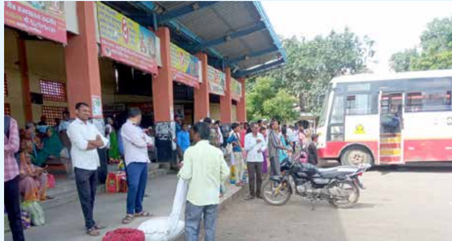
बाजारपेठेशी जोडणारी रिसोड ते मौजाबंदी बस फेरी १९८२ पासून अखंडपणे सुरू होती. सदर फेरी कुठलीही पूर्व सूचना न देता अचानक बंद करण्यात

कारभार अनेक वेळा चव्हाट्यावर आला आहे. नुकताच लोणी बुद्रुक गावाजवळ संभाजीनगर कडे जाणाऱ्या शिवशाही एसटी बसचे समोरील एक चाक निखळून बाजूच्या शेतात जावून पडले होते. या दुर्घटनेत जवळपास ४० प्रवाशांचा जीव बालबाल वाचला असल्याचे ताजे उदाहरण समोर आहे. तर याआधी सुद्धा अशा घटना घडल्या असून, केवळ नशीब बलवत्तर म्हणून प्रवाशांचे प्राण वाचले असल्याचे सर्वश्रुत आहे. तथापि या अक्षम्य घटनांचा जराही परिणाम आगार व्यवस्थापनावर झाला नसल्याचे प्रकर्षाने जाणवत आहे. आता तर, वाहतूक निरीक्षकांच्या मनमानी कारभाराने त्यावर कळस चढवला आहे. आपल्या मनमानी मर्जीनुसार पूर्वीपासून सुरू असलेल्या बस फेऱ्या ऐन वेळेवर रद्द करून प्रवाशांच्या गैरसोयीचा असुरी आनंद आगार व्यवस्थापन घेत असल्याचा प्रत्यय प्रवाशांना येत आहे. तालुक्यातील अनेक गावखेड्यांना मुख्य