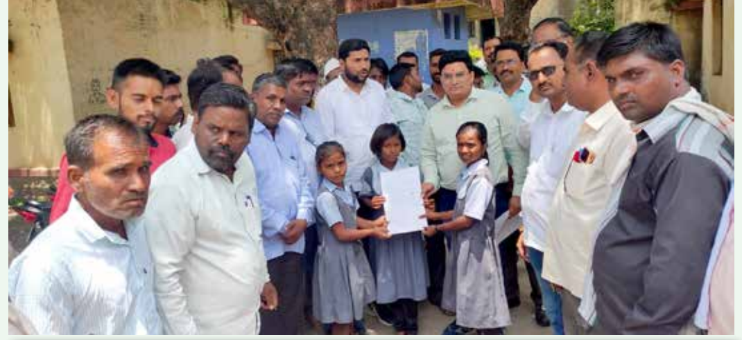
शासनाने जो सेवानिवृत्त शिक्षकांना परत मानधन तत्वावर सेवेत घेण्याचा निर्णय घेतला आहे त्याची त्वरित अंमल बजावणी केल्यास अनेक विद्यार्थी जे शिक्षणापासून वंचित राहिल्याने त्यांचा शैक्षणिक दर्जा घसरत चाललेले आहे व अनेक पालकांनी अशी अवस्था असल्याने आपले मुलांना खाजगी शाळेत प्रवेश देत आहे या अवस्थेमुळे जिल्हापरिषद मधील विद्यार्थी यांची संख्या दिवसेंदिवस घटत चाललेली आहे व शाळा बंद होण्याच्या मार्गावर आलेल्या आहे त्या तात्काळ निर्णय घेऊन शिक्षणाची भरती करणे आवश्यक आहे.

५) तालुक्यातील उपलब्ध असलेल्या १३ अतिरिक्त शिक्षकां पैकी एका शिक्षकाची आरडव येथील शाळेवर शैक्षणिक वर्ष संपेपर्यंत नियुक्ति करण्यात आली आहे.