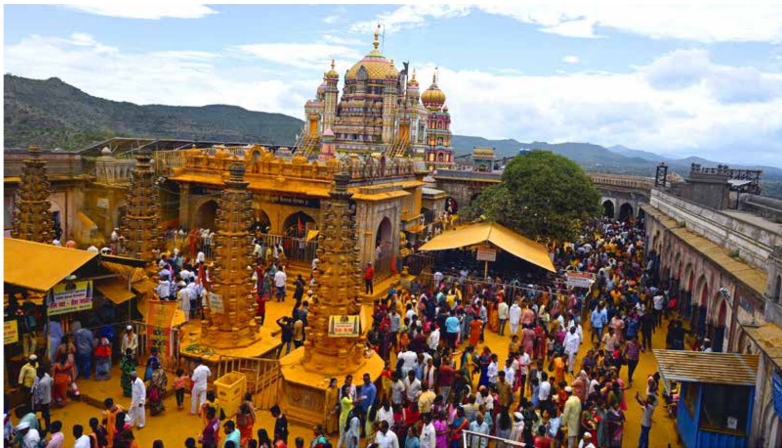
जेजुरी खंडोबा देवाचा गाभारा दुरुस्ती करिता दीड महिना बंद ठेवण्यात येणार असल्याचे समजताच भविक पर्यटकांनी रविवारी मंदिरावर गर्दी केली होती.