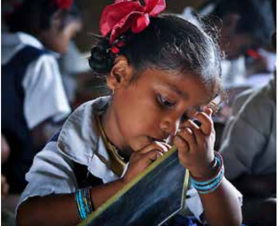
मध्ये अजिबात शंका नाही. कारण आपल्याकडं असणाऱ्या

घडणाऱ्या प्रत्येक घटना घडामोडी विषयी परफेक्ट आध्यात्मिक ज्ञान नसेल तर मग मात्र आपण नशेच्या मार्गावर धावणार या