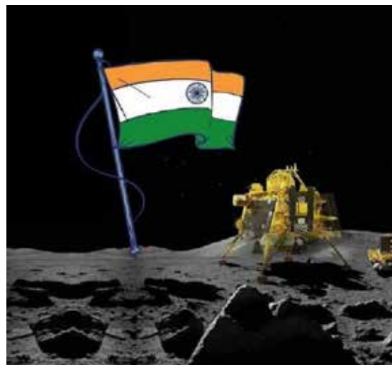
चंद्रावर मानव पाठवण्याचे स्वप्न साकार होईल. भारत अंतराळ क्षेत्रात एक महासत्ता म्हणून उदयास येईल एकूणच भारताच्या

वेळेच्या मोहिमेच्या अपयशातून धडा घेत यावेळी शास्त्रज्ञांनी या मोहिमेसाठी पुरेपूर काळजी घेतली होती. यानातील काही घटक ऐनवेळी कार्यन्वित होऊ शकले नाही तरी यान चंद्रावर यशस्वीपणे उतरेल अशी नव्या यानात रचना करण्यात केल्याची माहिती इस्रोचे संचालक एम सोमनाथ यांनी दिली होती. सेन्सर निकामी होणे, इंजिनमध्ये बिघाड होणे, संगणकातील नियमसंच व गणितीय प्रक्रिया यात होणाऱ्या चुकांची तपासणी करून त्याचे निराकरण करणे यासारख्या बाबींचा विचार करूनच हे यान चंद्रावर झेपावले त्यामुळे यावेळी आपले यान चंद्रावर यशस्वीपणे उतरेलच असा विश्वास देशातील १४० कोटी जनतेला होता. इस्रोच्या शास्त्रज्ञांनी अखेर हा विश्वास सार्थ ठरवला. चांद्रयान ३ मोहीम ही भारताच्या दृष्टीने अतिशय महत्वाची आहे. भारताचे हे यान चंद्रावर उतरल्याने चंद्रावर यान उतरवण्यात यशस्वी ठरलेल्या काही मोजक्या देशात भारताचा समावेश झाला. या मोहिमेद्वारे आपल्या देशातील विकसीत तंत्रज्ञान जगाला दाखवण्याची संधी मिळेल. अंतराळ तंत्रज्ञान व उद्योग यांची सांगड घालून अर्थव्यवस्थेला गती मिळेल. ही मोहीम यशस्वी झाल्याने भविष्यात