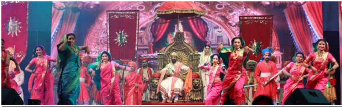
2047 च्या आत्मनिर्भर भारतासाठी चंद्रपुरचे योगदान राहिल : देशाचे पंतप्रधान नरेंद्र मोदी यांच्या संकल्पनेतून 9 ऑगस्ट 2023 पासून 'मेरी माटी मेरा देश' ( माझी माती माझा देश ) या उपक्रमाला सुरुवात झाली .जिल्हा प्रशासनाच्या वतीने गावपातळीपर्यंत हा उपक्रम अतिशय उत्साहपूर्ण वातावरणात पार पडला . सन 2047 रोजी भारतीय स्वातंत्र्याला 100 वर्षे पूर्ण होणार आहे . 2047 च्या आत्मनिर्भर भारतासाठी चंद्रपुरचे नक्कीच योगदान राहिल, अशी अपेक्षा राज्याचे सांस्कृतिक कार्य मंत्री तथा जिल्हाचे पालकमंत्री सुधीर मुनगंटीवार यांनी व्यक्त केली .