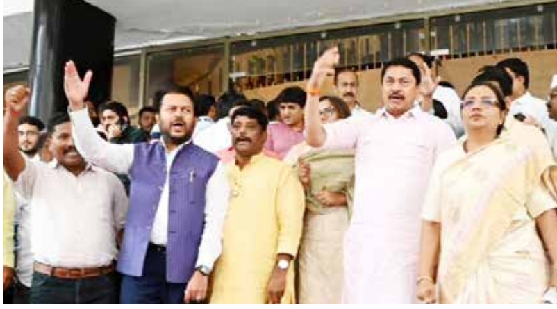
राहुल गांधी यांच्या शिक्षेला स्थगिती दिल्याचा आनंद काँग्रेस पक्षाच्या आमदारांनी विधानभवनाच्या पायऱ्यांवर व्यक्त केला. तसेच राज्यभर काँग्रेस कार्यकर्त्यांनी फटाके फोडून, मिठाई वाटत जल्लोष केला.

“राहुल गांधी यांना मिळालेला दिलासा म्हणजे संविधान, लोकशाही आणि भारताचा विजय आहे . भारताच्या जनतेचा हा विजय आहे . लोकशाहीचा विजय आहे . यामुळे खूप मोठा फायदा देशाच्या लोकांना झाला आहे . जो व्यक्ती देशाच्या हितासाठी, सत्येसाठी, देशाला मजबुती आणण्यासाठी, देशाच्या तरुणांसाठी, महागाईविरोधात लढतो आणि लढता लढता लोकांना जागृत करण्याकरता कन्याकुमारी ते काश्मीरपर्यंत ४ हजार किमीपेक्षाही जास्त चालत गरिबांना भेटतो, लहान मुलांना भेटतो, आज मी समजतो की तुमच्या सर्वांचे आशिर्वाद आमच्यासोबत आहेत”, असं मल्लिकार्जुन खरगे म्हणाले .