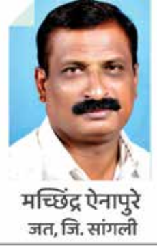
मच्छेंद्र ऐनापुरे जत, जि. सांगली