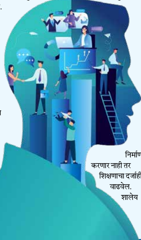
निर्माण करणार नाही तर शिक्षणाचा दर्जाही वाढवेल. शालेय

NEP 2020 मुळे शिक्षण आणि कौशल्य विकास यातील पृथक्करण संपुष्टात येईल. तो दिवस दूर नाही जेव्हा भारतातील तरुण, कौशल्य विकास आणि व्यावसायिक, रोजगारक्षम शिक्षणाद्वारे, उपजीविका शोधणारे नव्हे तर रोजगार देणारा बनतील. भारताने केवळ कौशल्य विकासावरच नव्हे तर कौशल्यवर आधारित रोजगार संधींवरही भर दिला पाहिजे. उद्योगांच्या गरजेनुसार कौशल्य विकास केल्यास सुशिक्षित बेरोजगारीच्या संकटातून सुटका होऊ शकते. सत्य हे आहे की भारतातील गरिबीसह ग्रामीण बेरोजगारी आणि असंघटित क्षेत्रातील कामगारांचे प्रश्न कौशल्य विकासानेच सुटू शकतात. राष्ट्रीय शैक्षणिक धोरणाला या दिशेने प्रात्यक्षिक आधारित प्रामाणिक प्रयत्न करावे लागतील, हाही त्याच्या मूल्यमापनाचा आधार असेल.