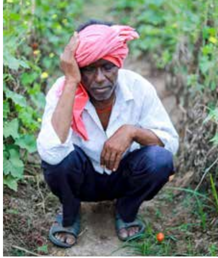
राज्य सरकारचे २ हजार रुपये जमा न झाल्यामुळे या सरकारच्या निर्णयामुळे तीव्र नाराजी व्यक्त करत

शासनाकडून शेतकऱ्यांची वारंवार चेष्टाच केली जात आहे. असा प्रश्न शेतकरी संघटनेचे जिल्हाध्यक्ष यांनी उपस्थित केला. केंद्र शासनाकडून पंतप्रधान शेतकरी सन्मान योजना लागू केली आणि शेतकऱ्यांच्या खात्यावर २ हजार रुपये जमा होवू लागले. वर्षाला सहा हप्त्यात १२ हजार रुपये शेतकऱ्यांच्या खात्यावर म गोल तिन वर्षांपासून जमा होण्यास सुरुवात झाली. राज्यातील सरकार बदलल्यानंतर शिंदे सरकारने शेतकऱ्यांनाही राज्य सरकार केंद्र सरकारप्रमाणे मदत करेल अशी घोषणा केली आणि ही मदत या १४ व्या हप्त्यापासून दिली जाणार असल्याचे जाहीर केले. शेतकरी एकीकडे खुश झाला होता. कारण आता २ हजारऐवजी ४ हजार रुपये मिळणार या आनंदात शेतकरी वर्ग होता आणि हा हप्ता कधी जमा होईल याची वाट प्रत्येक शेतकरी लाभार्थी पाहत होता. दि. २८ जुलै २०२३ रोजी शेतकऱ्यांच्या खात्यात केंद्र सरकारचे २ हजार रुपये जमा झाले. मात्र या सोबत