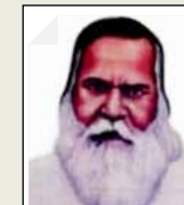
स्वर्वेद रचनाकार अनन्त श्री सद्गुरू सदाफल देवजी महाराज

संदर्भ : हा ग्रंथ तुम्हाला हवा असल्यास वॉट्सअप करा ८५५४८८३१६६.