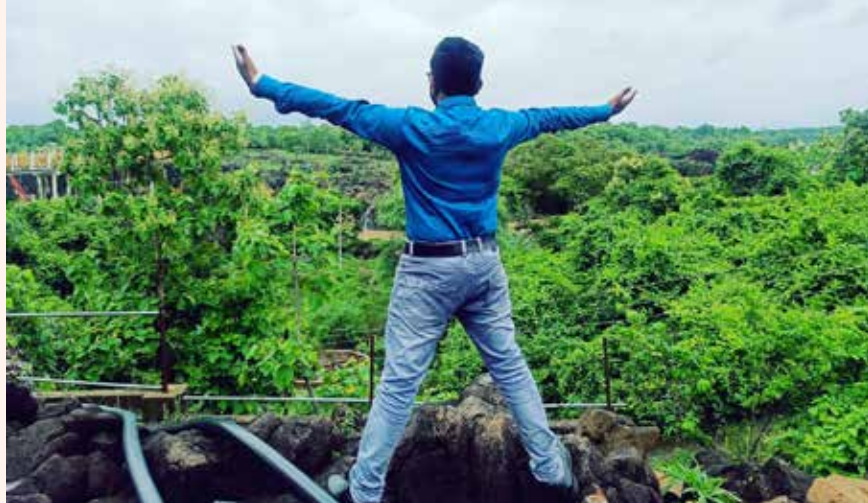
आपण जर ताण-तणावमुक्त राहिलो तर आपल्याला आयुष्यामध्ये कधीच आपल्या वाटेला दुःख येत नाही आणि आपण आनंदाने जीवन जगण्यासाठी नवीन

करत असतात आणि ज्या गोष्टी आपल्याला साध्य होत नाहीत त्या गोष्टी आपण सोबत घेऊन राहणे या विचारसरणीमुळे आपली स्वतःची मानसिक संतुलन बिघडण्याची वेळ सुद्धा येऊ शकते कारण