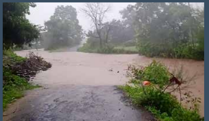
शेताला शेततळ्याचे रूप आले. चोंडी, चोळाखा, रोशनगाव, पाटोदा ह्या नदी काठाच्या गावांना व शेतीतील पीक पाण्याखाली आले आहेत. आटाळासह विविध गावात बत्तीगुल झाली आहे. पाऊसाच्या रुद्रावतारामुळे

सामान्य नागरिक, शेतकरी, शेतमजूर, कामगार यांच्या शेतात व घरात पाणी शिरल्यामुळे मोठे नुकसान झाले आहे. त्याचा तात्काळ पंचनामे करून नुकसान भरपाई मिळावी आणि ओला बुष्काळ जाहीर करावा अशी मागणी होत आहे.