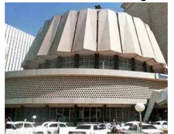
निर्णय घेण्यात आला आहे.

आज घेण्यात आलेल्या निर्णयानुसार शनिवार, रविवार, सोमवार, मंगळवार असे चार दिवस अधिवेशन होणार नाही. तर, पुढील बुधवार, गुरुवार आणि शुक्रवार असे तीन दिवस अधिवेशन होणार आहे. विधानसभा कामकाज सल्लागार समितीच्या बैठकीत हा