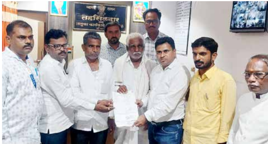
करताना शेतकऱ्यांना ब-याच अडचणीचा सामना करावा लागतो आहे. या जाचातून सहिसलामत सुटका करण्यासाठी शासनाने जानेवारी २०२३ मध्ये "सलोखा"

भोकर : कृषी प्रधान देशात शेतकऱ्यांना न्याय मिळवून देण्यासाठी शासनातर्फे विविध योजनांची अंमलबजावणी केली जाते. शेती व्यवसाय करताना अनेक समस्यांना सामोरे जावे लागते. यातून त्यांची सुटका व्हावी म्हणून शासनाने नुकतीच "सलोखा" योजना सुरू केली. सदरील योजनेचा राज्यात पहिला लाभार्थी हा भोकर तालुक्यातील असून अवघ्या दिड महिन्यात शेतकऱ्यांना न्याय मिळाला आहे. यासाठी महसूल आणि दूर्यक निबंधक विभागाने मोलाचे सहकार्य केले आहे. #शेतकरी हा देशाचा आर्थिक कणा म्हणून ओळख आहे. राज्यातील बहुतांश भागात शेती हा मुख्य व्यवसाय आहे. कृषी प्रधान देशातील शेतकरी सुखी समाधानी असेल तरच देशाची उन्नती होईल. याच मुळ हेतुने शासन स्तरावर शेती व्यवसायास प्रथम प्राधान्य देण्यात आले आहे. तरी शेतकऱ्यांना म्हणावा तसा दिलासा मिळत नसल्याची खंत व्यक्त केली जात आहे. शेती व्यवसाय