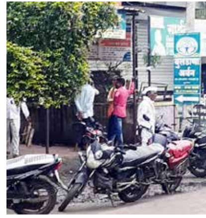
अर्बन सर्व सामाजिक उपक्रमामध्ये सहभाग संस्थेच्या शाखा कळमनुरी येथील काही मंचान्यांनी

फुलंब्री : बुलढाणा अर्बन को ऑफ क्रेडिट सोसायटीच्या ४७५ वर शाखा भारताच्या महाराष्ट्र गुजरात राजस्थान मध्यप्रदेश छत्तीसगड गोवा तेलंगणा सीमाग्र अंदमान निकोबार येथे कार्यक्षेत्र असून शाखा तेथे गोदाव ६७३ वेअर हाऊस शेतकरी व्यापार करी माल देवण्याची सुविधा, तसेच पुणे व बुलढाणा येथील वस्तीगृहामध्ये सभासदांनाच्या पाल्यांना वस्ती सुविधा, संस्थेचे सहकार विद्या मंदिर बुलढाणा जिल्हा शाळा सी बी एस सी पॅटर्न, तिरुपती बालाजी आंग्र प्रदेश माहूर शिडी भक्ती निवास सुविधा बुकिंग सुविधा सर्व शाखेमध्ये उपलब्ध, महाराष्ट्राच्या मुख्य हायवेवर बारा रुग्णवाहिका २४ तास सेवेत, बीओटी तत्वावर मलकापूर चिखली महामार्ग बांधकाम व बुलढाणा