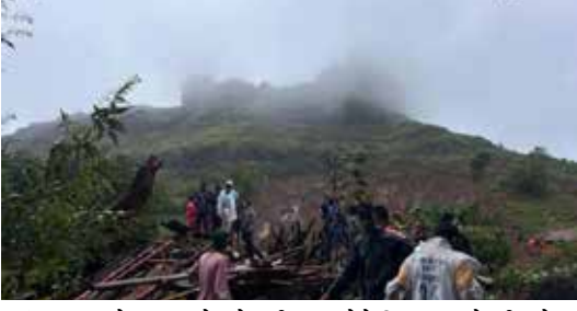
हॉस्पिटलमध्ये जाऊन भेट घेतली व अस्तेने विचारपूस केली तसेच सर्वतोपरी सहकार्य करण्याचे शब्द दिला आहे.