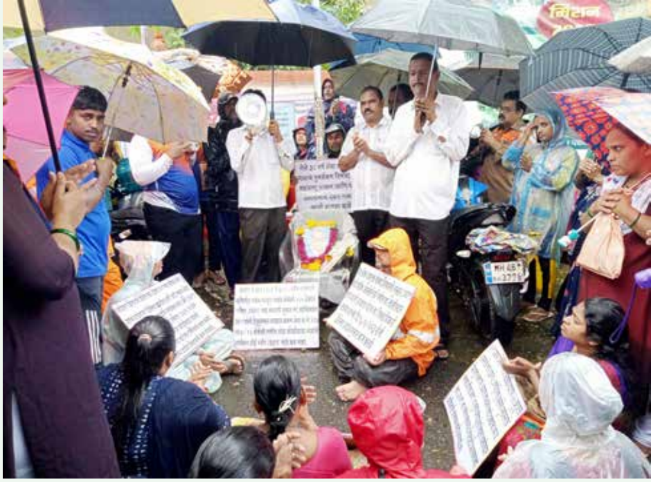
आधुनिक केसरी न्यूज

उरण : तालुक्यातील जुना शेवा कोळीवाडा येथील जमीन जेएनपीटी (जेएनपीटी) बंदरासाठी संपादित झाली. या जुना शेवा कोळीवाडा ग्रामस्थांचे उरण तालुक्यातील हनुमान कोळीवाडा येथे पुनर्वसन करण्यात आले. मात्र हनुमान कोळीवाडा गावात सर्व घरांना वाळवी लागल्याने व हे जागा राहण्यास योग्य नसल्याने या नागरिकांचा पुनर्वसनाचा प्रश्न ऐरणीवर आला होता. शिवाय शासनाच्या माप दंडा नुसार हे पुनर्वसन झाले नव्हते त्यामुळे गेली ३८ वर्षे जुना शेवा कोळीवाडा (हनुमान कोळीवाडा) ग्रामस्थांचा पुनर्वसनाचा प्रश्न प्रलंबितच आहे. रायगड जिल्हाधिकारी रायगड यांच्या आदेशानुसार एन.एस.पी.टी.प्रकल्प विस्थापित शेवा कोळीवाडा गावाचे ३८ वर्षांनी पुनर्वसनाचे मा.तहसीलदार उरण हे जे.एन.पी.टी.च्या दबावाखाली हेतुपुरस्पर काम करत नसल्याचे संशयाच्या निषेधार्थ एकता महिला बचतगट हनुमान कोळीवाडा व इतर सर्व महिला बचत गटातर्फे आज