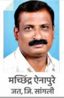
मच्छिंद्र ऐनापुरे जत, जि. सांगली

आज स्त्री-पुरुष समानतेचा नवा अध्याय लिहिण्याची चर्चा सुरू असताना, लहान मुलींवरील बलात्काराच्या बातम्या वाचून आणि ऐकून आपल्या मनात संतापाच्या लाटा उसळतात. बस, ट्रेन, सार्वजनिक ठिकाणी महिलांची चेष्टा करणे, त्यांचे कपडे, राहणीमान, बोलणे, शारिरीक रूप, रंग इत्यादींबद्दल असभ्य टिप्पण्या करणे, घरगुती महिलांच्या कामाचे अवमूल्यन करणे इत्यादी गोष्टी म्हणजे स्वतःच एक दुःखद आश्चर्य आहेत. खरे तर, खर्या अर्थाने स्त्री-पुरुष समानता संपूर्ण जगात अजून खूप दूरची गोष्ट आहे. संयुक्त राष्ट्रने महिला समानतेबाबत 2017 ते 2022 या कालावधीत जगभरातून गोळा केलेल्या आकडेवारीच्या आधारे असे म्हटले आहे की, दहापैकी नऊ जणांना महिलांबाबत भेदभाव वाटतो.