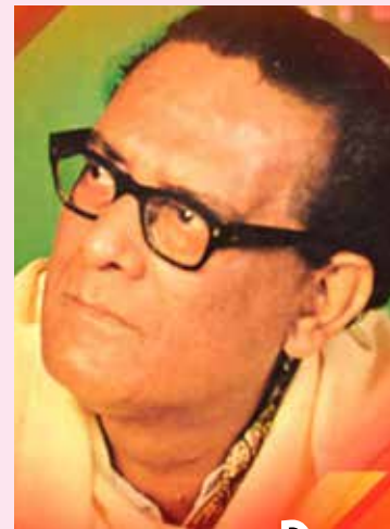
तुम पुकार लो...

तर आजही रसिकांच्या ओठांवर आहेत. हेमंतदांना आपल्या कारकिर्दीत अनेक पुरस्कारांचे मानकरी ठरले. फिल्मफेअर पुरस्कार, राष्ट्रीय चित्रपट पुरस्कार तसेच गायक म्हणून, संगीतकार म्हणून अनेक पुरस्कार त्यांना मिळाले आहेत. रवींद्र भारती विश्वविद्यालयाने त्यांना सन्माननीय डी लिट प्रदान केली आहे. हेमंतदांनी मराठी चित्रपटातही काही गाणी गायिली आहेत आणि मराठी रसिकांची ती आवडती आहेत. हा खेळ सावल्यांचा या चित्रपटातील 'गोमू संगतीनं माझ्या तू येशील काय' तसाच लतादीदींसोबत असलेलं 'मी डोलकर डोलकर दर्याचा राजा' ही गाणी कमालीची लोकप्रिय झाली. दर्यावरील रं, चालली होरी रं... प्रीतीच्या चांदराती, प्रीती तुझी मनमोहिनी ही त्यांची मराठी भावगीते देखील लोकप्रिय आहेत. अशा या प्रतिभादत्त संगीतकार आणि गायकाचे २६ सप्टेंबर १९८९ रोजी हृदयविकाराचा झटका आल्याने कोलकाता येथे देहावसान झाले.