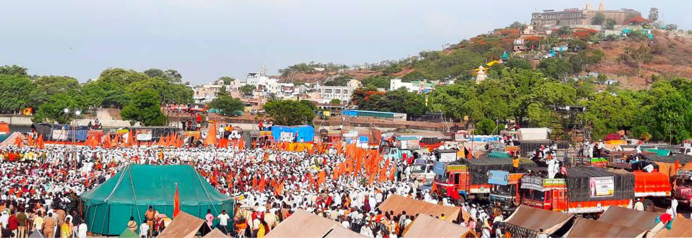
वैष्णवांचा मेळा मल्हारी द्वारी विसावाला... जेजुरीत माऊलींच्या पालखीचे आगमन होताच येळकोट येळकोट जयमालहार गर्जना करीत भक्तांनी एकच कल्लोळ केला. पालखी विसवल्याचे विहंगम दृश्य.

YEAR-02 • ISSUE-276 • RNI : MAHMAR/2021/82566 • PAGE-16 • PRICE-5