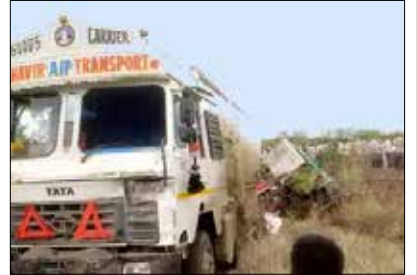
तीन ते चार जण गंभीर जखमी आहेत. त्यांना अक्कलकोट ग्रामीण रुग्णालयात उपचारासाठी दाखल करण्यात आले आहे. अक्कलकोट उत्तर पोलीस ठाण्याचे वरीष्ठ पोलीस अधिकारी आणि कर्मचाऱ्यांनी घटनास्थळी जाऊन पंचनामा केला.