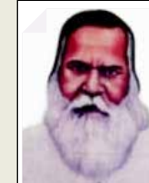
स्वर्वेद रचनाकार अनन्त श्री सद्गुरू सदाफल देवजी महाराज

अन्ध जीव क्यो भूलहूँ, भज ले पुरुष पुरान ।।५२।। (स्वर्वेद चतुर्थ मण्डल षष्ठ अध्याय) ०४/०६/५२ मूळ भाष्याचा मराठी अनुवाद : जीवन आज आहे उद्या राहिल की नाही, याचा भरवसा नाही. हे ज्ञानचक्षु हीन जीवांनो ! या अनित्य मायेत काय भुललात ? तुम्ही नित्य-अनादी परम पुरुषाची उपासना करा.