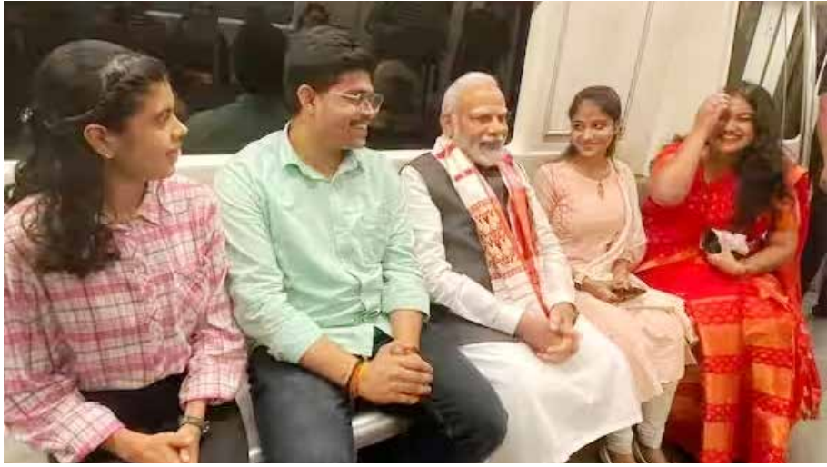
दिल्ली विद्यापीठात पोहोचण्यासाठी पंतप्रधान नरेंद्र मोदींनी शुक्रवारी मेट्रोने प्रवास केला. विद्यापीठाच्या शताब्दी सोहळ्याच्या समारोप समारंभाला प्रमुख पाहुणे म्हणून मोदी व केंद्रीय शिक्षण मंत्री धर्मेंद्र प्रधान उपस्थित राहणार आहेत. या प्रवासात मोदींनी प्रवाशांशी संवाद साधला.

मुंबई : देशात कांद्याच्या दरवाढीची चर्चा यापूर्वी कित्येकदा झाली आहे. राज्य सरकारच नाही तर केंद्र सरकार पण कांद्याच्या वाढ्यावरून चिंतेत पडलेले आहे. कांदा दरवाढीची भीती अनेक राज्य सरकारांना माहिती आहे. पण सध्या देशात टोमॅटोने ग्राहकांच्या तोंडचे पाणी पळवले आहे. आता आणखी कांद्याची त्यात भर पडणार आहे. कांदा सर्वसामान्यांचा खिसा खाली करू शकतो. कांद्याच्या किंमतीत वाढ होण्याची शक्यता आहे. टोमॅटोने आता कांदा सर्वसामान्यांना रडविण्याच्या तयारीत आहे. सुरुवातीला 80 रुपये किलो दराने टोमॅटो विक्री झाले. देशातील काही भागात टोमॅटोचा दर 100-120 रुपये प्रति किलोवर पोहचला. आता कांद्याचा क्रमांक आहे. काय आहे यामागील कारणे. केंद्र सरकारने कांदा उत्पादनाचे आकडे समोर आणले आहे. त्यानुसार, महाराष्ट्रातील पाच क्षेत्रात गेल्या महिन्यात कांद्याच्या किरकोळ किंमतीत वाढ झाली आहे. गेल्या वर्षीच्या तुलनेत या किंमती कमी आहेत. सरकारी डेटानुसार, भारतात वर्ष 2020 मध्ये कांद्याच्या सरासरी किंमती 35.88 रुपये, 2021 मध्ये कांद्याच्या सरासरी किंमती 32.52 रुपये आणि 2022 मध्ये 28 रुपये प्रति किलो होत्या. 2023 मध्ये आतापर्यंत या किंमती स्थिर आहेत. पण गेल्या काही महिन्यात या किंमती वाढू शकता. केंद्र सरकारने दोन महिन्यांअगोदर शेतकऱ्यांकडून जवळपास 0.14 दशलक्ष टन कांदा खरेदी केला. केंद्रीय मंत्री पियूष गोयल यांनी एप्रिल महिन्यात याविषयी घोषणा केली होती.