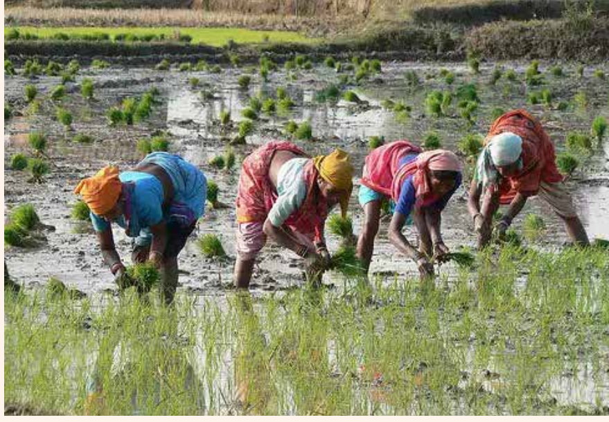
नाही म्हणूनच तर... आज त्याच्यासाठी कोणी पुढाकार घेत नाही, आपुलकीने मदत करत नाही, त्याला न्याय मिळवून देण्यासाठी कोणी ताकदीने झटत नाही त्यामुळे बळीराजाचा विकास होत नाही आजही तो

आज १ जुलै शेतकरी दिन त्या निमित्ताने सर्व शेतकरी बंधू, भगिणींना शेतकरी दिनाच्या मनपूर्वक हार्दिक शुभेच्छा एका अर्थाने बघायला गेले तर बळीराजावर बोलणं फार सोपं आहे, त्याच्यावर लिहिणं अजून सोपं आहे पण, खास करून त्याला वाचणे व समजून घेणे फार कठीण काम आहे. त्यासाठी एकदातरी त्या बळीराजासारखे एकतरी दिवस जगून बघावे लागते तेव्हाच, बळीराजा कळत असतो. नुसते बोलण्याने किंवा लिहिण्याने त्याच्यात असलेली महानता कळत नाही हे सुद्धा तेवढेच सत्य आहे. बळीराजा हा जगाचा पोशिंदा महापुरुष आहे. सारा विश्व त्याला चांगल्याप्रकारे जाणतो आहे कारण, त्याच्यात तेवढी महानता आहे तो, सर्वगुणसंपन्न आहे आणि खास करून जगवता आहे.