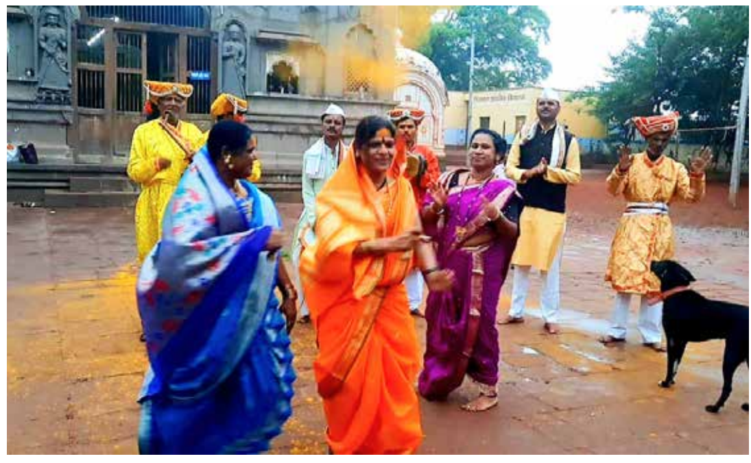
आषाढीनिमित्त खंडोबाच्या जेजुरीत वाघ्या मुरळीचा विठोबाचा नामगजर घातला.