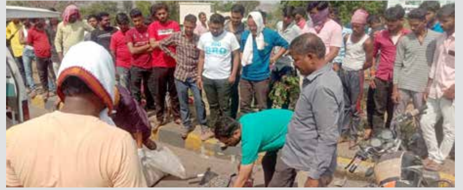
आहे. खरं तर चौफुलीच्या पुढे बांधण्यात आलेला उड्डणपूल हा काहीच कामाचा नसून तो उड्डणपूल हा या चौफुलीवरच आवश्यक होता. ह्या चौफुलीवर