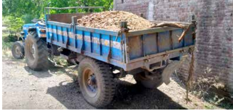
शासनाचा महसूल बुडवून जेसीबीद्वारे खोदकाम करून ट्रॅक्टर ने वाहतुकीचे प्रकार वाढले आहेत. दरम्यान बुधवारी सोयगावचे

सोयगाव : शहर परिसरात शासनाचा महसूल बुडवून चोरट्या मार्गाने अवैध गौण खनिज वाहतूक करणाऱ्यांनी पुन्हा डोके वर काढले आहे. बुधवारी (दि.१०) सकाळी सोयगाव- बनोंटी रस्त्यावर शासकीय गौण खनिजाने भरलेला ट्रॅक्टर सोयगाव तहसील कार्यालयाच्या भरारी पथकाने पकडून तहसील कार्यालयात जमा केला आहे. महसूल विभागाच्या या धडक कारवाईमुळे चोरट्या मार्गाने अवैध गौण खनिज माफियांमध्ये खळबळ उडाली आहे. सोयगाव व परिसरात