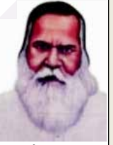
स्वर्वेद रचनाकार अनंत श्री सद्गुरू सदाफल देवजी महाराज

दुख कारण मन भोग है, दुख कारण अभिमान । दुख कारण गुरु द्वेष है, सद्गुरु नहि सनमान ॥४६॥ (स्वर्वेद पंचम मण्डल एकादश अध्याय) ०५/११/४६ मूळ भाष्याचा मराठी अनुवाद : दुःखाचे कारण मनाचा भोग आहे. मनाच्या विषयोपभोगाद्वारेच जीवनाचे पतन होऊन दुःख प्राप्त होते. दुःखाचे कारण अभिमान तसेच गुरू-द्रोह आणि सद्गुरूची अप्रतिष्ठा आहे.