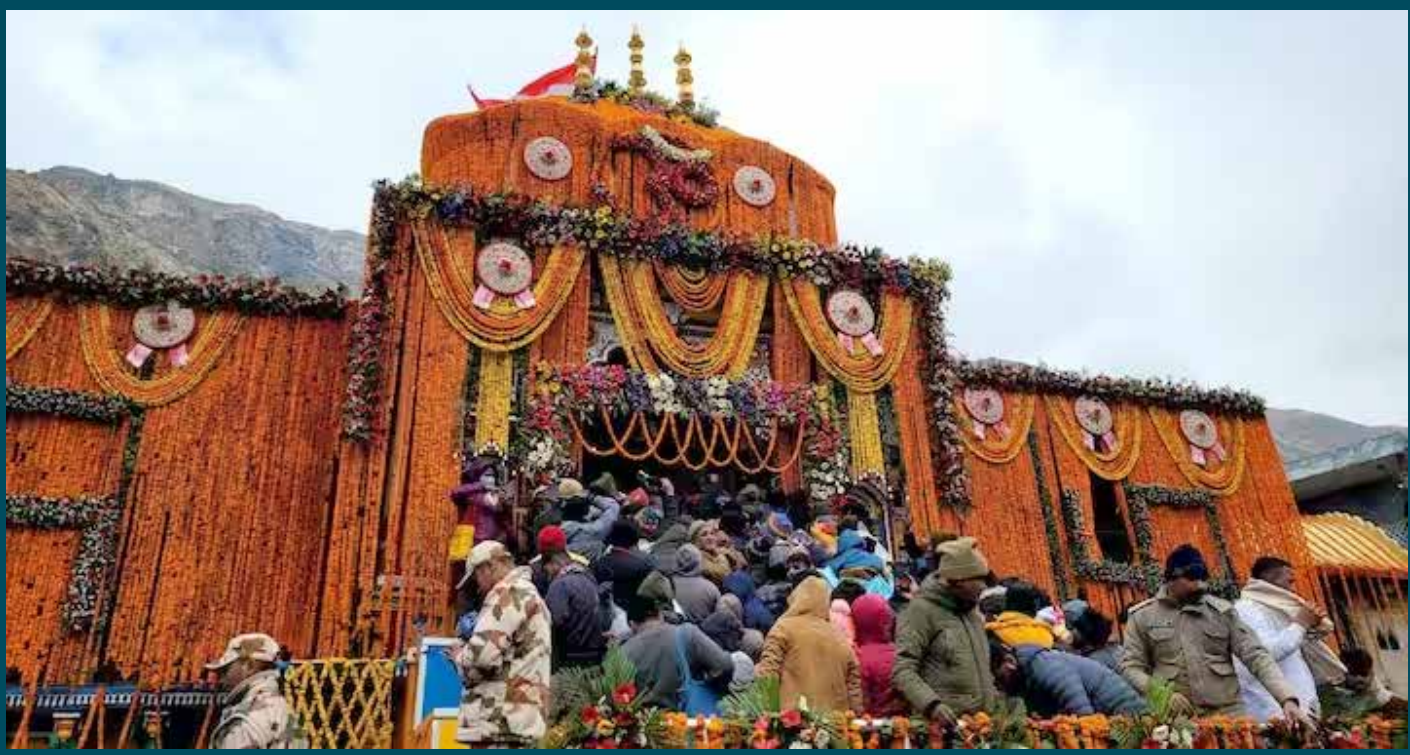
बद्रीनाथ मंदिराचे गुरुवारी दरवाजे उघडल्यानंतर चारधाम यात्रेला सुरुवात झाली असून मंदिर भाविकांसाठी खुले करण्यात आले आहे. दर्शनासाठी हजारो भाविकांनी गर्दी केली आहे.

उपचार विज्ञानाचा अवलंब करतात त्यांच्या स्वरूपामुळे आणि आधुनिक वैद्यकीय तंत्रज्ञानाच्या प्रगतीमुळे अॅलोपॅथी डॉक्टर आकस्मिक कामे करण्यास सक्षम आहेत. त्यांनाच गंभीर जखमींवर तातडीचे उपचार करावे लागतात. ते आयुर्वेदिक डॉक्टर करू शकत नाहीत', असे असे न्या. व्ही. रामसुब्रमण्यम व न्या. पंकज मिश्र यांच्या खंडपीठाने नमूद केले. एमबीबीएस पदवीधारक डॉक्टर हे गुंतागुंतीच्या शस्त्रक्रिया करणाऱ्या शल्यविशारदांना (सर्जन) जशी मदत करू शकतात, तसे करणे आयुर्वेदिक डॉक्टरांना शक्य नाही, याचाही खंडपीठाने उल्लेख केला. शहरांमधील सामान्य रुग्णालयांमध्ये बाह्यरुग्ण विभागात अॅलोपॅथीच्या डॉक्टरांना दिवसाला शेकडो रुग्णांवर उपचार करावे लागतात, तसे आयुर्वेद व्यावसायिकांना करावे लागत नाहीत, असेही खंडपीठाने म्हटले आहे. आयुर्वेद आणि पर्यायी किंवा स्वदेशी औषध पद्धतीला प्रोत्साहन देणे आवश्यक आहे, हे मान्य. मात्र, दोन्ही श्रेणीतील डॉक्टर एकसारख्या वेतनास पात्र ठरविण्यासाठी समान पद्धतीचे काम करत नाहीत, या वस्तुस्थितीकडे आपण दुर्लक्ष करू शकत नाही.