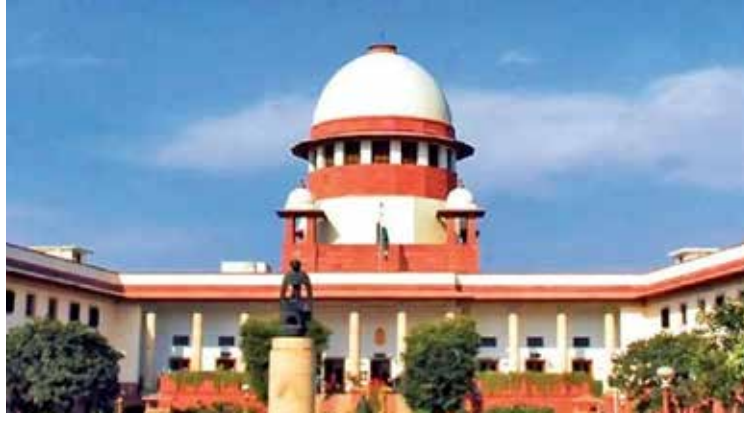
निवडीचा अधिकार आहे. याच युक्तीवादाच्या आधारे कोणी आव्हान देऊ शकत नाही

नवी दिल्ली : समलिंगी विवाह कायद्यासाठी सर्वोच्च न्यायालयात सुनावणी सुरू आहे. गुरुवारी सुनावणीचा सहावा दिवस होता. आजच्या दिवशीही सॉलिसिटर जनरल तुषार मेहता यांनी केंद्र सरकारची बाजू लावून धरली. जोडीदार निवडीच्या अधिकाराचा मुद्दा उपस्थित करून याचिकाकर्त्यांनी समलिंगी विवाह कायद्याची मागणी केली आहे. मात्र, या विवाहाला मान्यता दिल्यास अनैतिक संबंधांनाही संरक्षण मिळेल, असे तुषार मेहता यांनी म्हटले आहे.