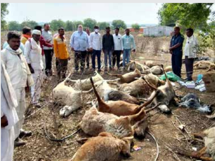
शक्य होऊन तेवढ्या संख्येने मला रोख स्वरूपात मदत करण्यात यावी यासाठी